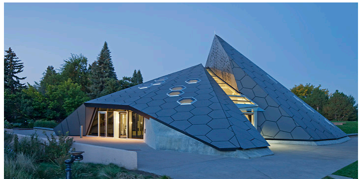
Рис. 3. Наукова піраміда