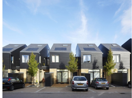
Рис. 6. Будинки Newhall South Chase

Висновки. Таким чином, активна сонячна архітектура – галузь енергоефективного дизайну, що у сучасності займає певне місце у екологічній та енергоефективній архітектурі. Концепція використання сонячних панелей мала декілька періодів розквіту, здебільшого орієнтуючись на економічну ситуацію провідних держав.