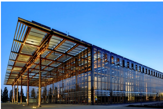
Рис. 2. Центр додаткової освіти

Також своїм сонячним дизайном відрізняється вразливий фасад павільйону Ендеса у Барселоні (Каталонія, Іспанія) (рис. 4). Завдяки використанню параметричного дизайну, Інститут передової архітектури Каталонії розробив кутовий фасад павільйону, щоб максимізувати ефективність вбудованих сонячних панелей. Забудова виглядає естетично та відрізняється своєю енергоефективністю [6].