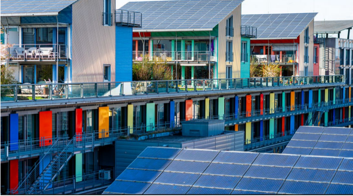
Рис. 5. Будівлі у міському районі Ваубан

Даний проект складається з 84 одиниць чотирьох типів будівель; 5 багатоквартирних будинків; 14 вілл; 29 будинків із внутрішнім двориком і 7 будинків із терасою. Усього 84 будівель [8]. Усі вони мають 5,4 кв. м фотоелектричної черепиці – це додавання панелі над похилим дахом, вкритим сірою черепицею, є стриманим, але також дуже ефективним [9].