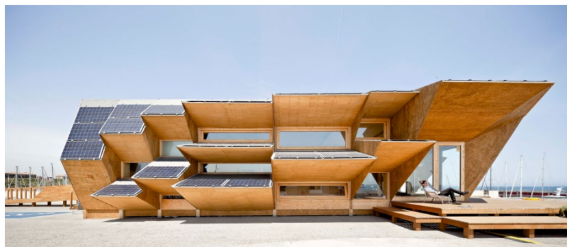
Рис. 4. Павільйон Ендеса

Насамперед, у європейських державах щорічно даються нові постанови щодо використання відновлювальної енергії. Встановлення в існуючих будівлях сонячних панелей або впровадження повсякденних енергоефективних інновацій включені у цей процес.