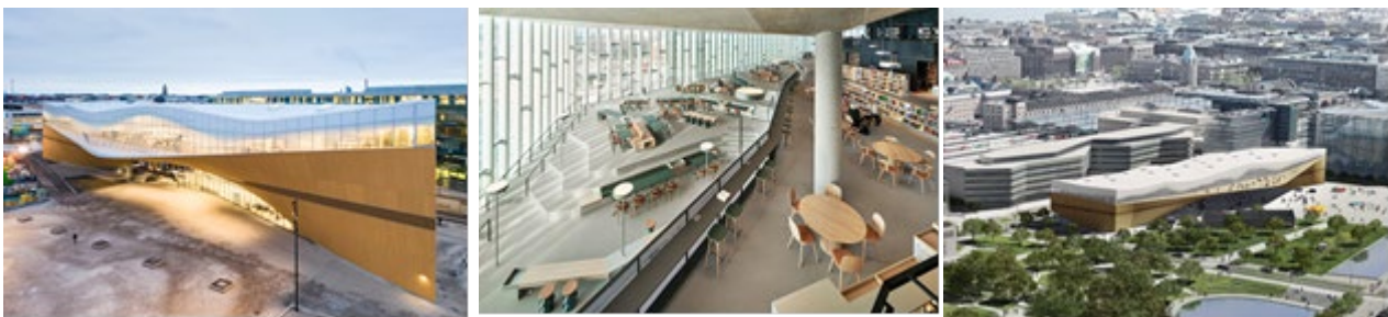
Рис. 8. Центральна бібліотека Oodi в Гельсінкі.

Нова бібліотека в Гельсінкі (рис.8.) – ультрасучасна та енергоефективна бібліотека, прогрес в архітектурній галузі. Нова центральна бібліотека Oodi – будівля зі скла та сталі з фасадом із дерева – на сьогоднішній день є найновішою пам'яткою столиці Фінляндії. Нова будівля швидко стала популярним місцем для проведення зустрічей та заходів. Каркас будівлі складається з двох сталевих арок довжиною понад 100 метрів, через що відбувається значне коливання конструкції – до 140 мм, і це також було враховано під час проектування. «Коливання сталевої конструкції будівлі досить значне і залежить від сезону, температури та навантаження на будівлю. Всі компоненти інженерних систем та технічне обладнання приховані та не потрапляють у поле зору відвідувачів. Проектувальники та архітектори працювали у тісній співпраці, щоб знайти інноваційні рішення для зменшення теплового навантаження, викликаного сонцем.