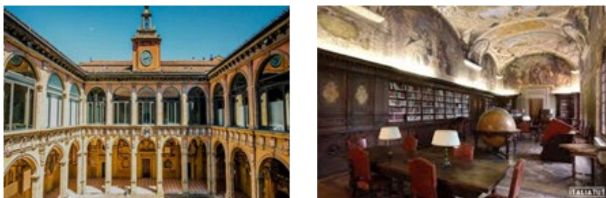
Рис.3. Болонський університет. Болонья, Італія.

На початку XVI століття в Європі нараховувалось близько 60 університетських бібліотек. Одна з відомих бібліотек розташована в Болонському університеті (Рис.3.) Бібліотека Університету Болоньї - одна з найстаріших і найпрестижніших бібліотек Італії. Вона була заснована в 1712 році і налічує понад 2 мільйони книг, рукописів, карт та інших документів. Бібліотека розташована в історичному центрі міста Болонья та складається з кількох будівель. Як сам університет, так і бібліотека в своєму образі та інтер'єрах зберігає середньовічну архітектуру.