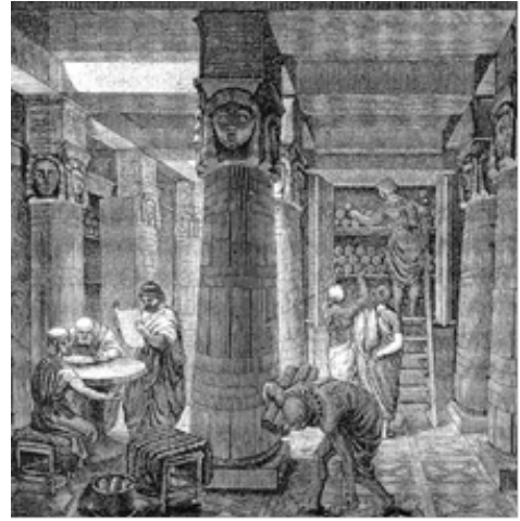
Рис.1. Стародавні бібліотеки світу.

У Стародавньому Єгипті бібліотеки створювалися при палацах та храмах. Напис на одній із стародавніх бібліотек Єгипту говорить: «Аптека для душі». Бібліографічний фонд найвідомішої Олександрійської бібліотеки стародавнього світу, у період розквіту складався з 700 – 800 тисяч текстів багатьма мовами. У стародавньому Вавилоні, ще в другому тисячолітті до н.е., була створена одна з найперших бібліотек на земній кулі. У ній зберігалися манускрипти, які докладно розповідали про так званий всесвітній потоп. В бібліотеці храму Кута перебували манускрипти, які описують історію створення світу та війну велетнів. Перський вчений візир Сахіб (середина X ст.) пристрасно любив книги, у його бібліотеці налічувалося близько 117 тис. рукописів.