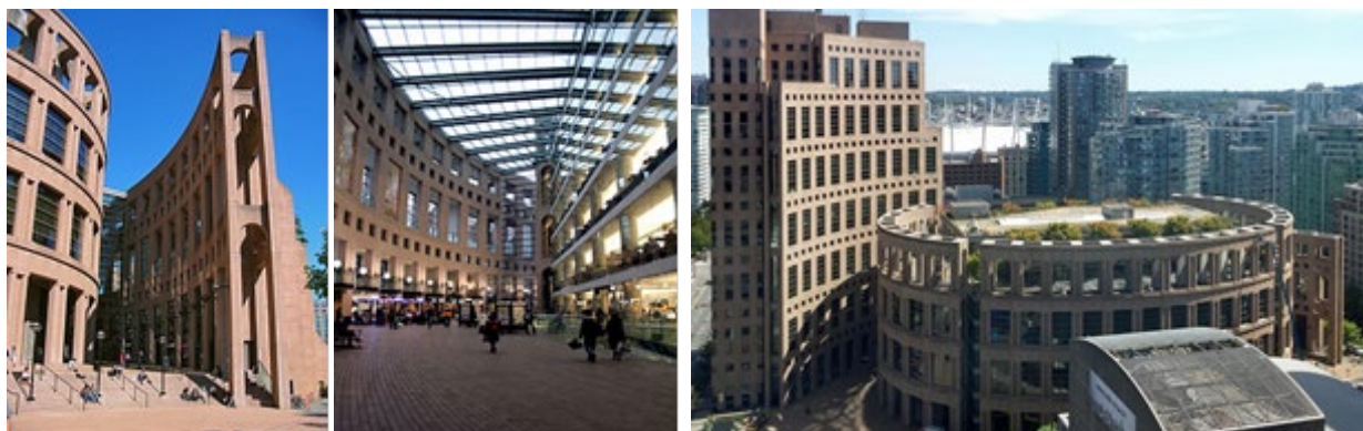
Рис.6. Ванкуверська публічна бібліотека

Найвідоміша у Ванкувері публічна бібліотека (рис.6.), була заснована у 1869 році та не втрачає своєї популярності і в наш час. Завдяки сучасним технологіям обслуговування в бібліотеці стало зручніше. Так, мешканці Ванкувера обслуговують як у самій установі, так і за допомогою спеціальної інтернет-програми. Знаходиться бібліотека на Лайбрарі-сквер, що включає центральне відділення Ванкуверської бібліотеки, вежу федерального уряду та низку закладів. Зовні він нагадує римський Колізей. У центрі комплексу знаходиться дев'ятиповерхова прямокутна будівля, в якій розміщується книгосховище та бібліотечні служби. Його оточує вигнута стіна з колонадою, де розташовані читальні зали; вони з'єднані з головною будівлею містками, прокладеними під скляним дахом. Дах вкриває простору залу у східній стороні комплексу, що знаходиться між будівлею бібліотеки та іншою вигнутою стіною. Він служить як вхідний вестибюль. Крім центрального відділення бібліотеки і федеральної вежі, комплекс включає кілька магазинів, ресторанів, а також підземне паркування. На даху бібліотеки розташований сад, спроектований канадським дизайнером Корнелією Оберландер.