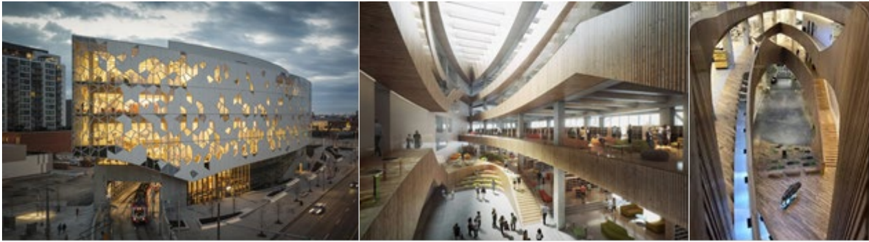
Рис.7. Центральна бібліотека Калгарі

Нова бібліотека в Гельсінкі (рис.8.) – ультрасучасна та енергоефективна бібліотека, прогрес в архітектурній галузі. Нова центральна бібліотека Oodi – будівля зі скла та сталі з фасадом із дерева – на сьогоднішній день є найновішою пам'яткою столиці Фінляндії. Нова будівля швидко стала популярним місцем для проведення зустрічей та заходів. Каркас будівлі складається з двох сталевих арок довжиною понад 100 метрів, через що відбувається значне коливання конструкції – до 140 мм, і це також було враховано під час проектування. «Коливання сталевої конструкції будівлі досить значне і залежить від сезону, температури та навантаження на будівлю. Всі компоненти інженерних систем та технічне обладнання приховані та не потрапляють у поле зору відвідувачів. Проектувальники та архітектори працювали у тісній співпраці, щоб знайти інноваційні рішення для зменшення теплового навантаження, викликаного сонцем.