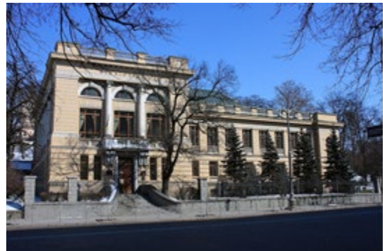
Рис.4. Національна бібліотека України ім. Ярослава Мудрого(1911р.-2012р.)

Найстаріша діюча бібліотека України – наукова бібліотека Львівського університету, заснована в 1608 році при колегії єзуїтів. Перша публічна бібліотека в Україні відкрилася в 1830 році в Одесі. Найбільша в Україні Центральна наукова бібліотека імені В. І. Вернадського НАН України заснована в 1918 році і налічує понад 13 млн. одиниць зберігання.