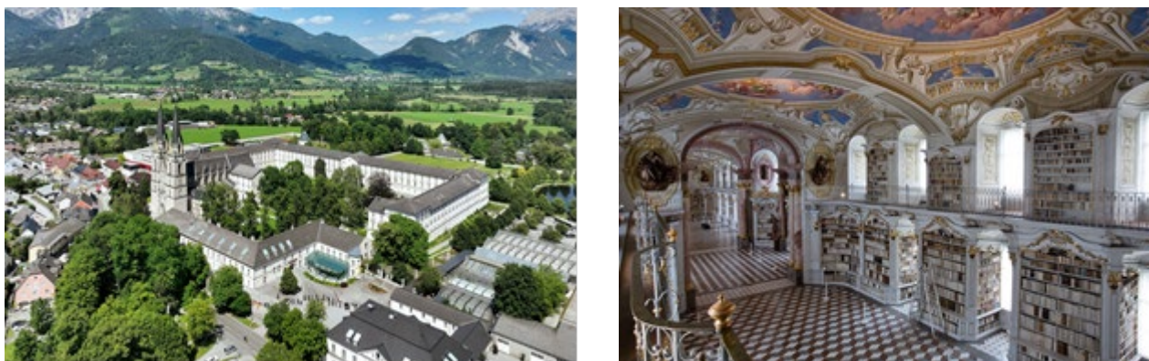
Рис.2. Бібліотека Адмонтського абатства.

Будівництво бібліотеки Адмонтського абатства розпочалося 1074 року і було завершено 1776 року. Сучасне приміщення бібліотеки було споруджене 1776 року за проектом архітектора Йозефа Гюбера за наказом монарха абата Маттеуса Оффнера. Стеля складається з семи куполів, прикрашених фресками Бартоломео Альтомонте, які показують етапи людського знання аж до найвищої точки Божественного Відкровлення. Денне світло пропускають 48 вікон, а архітектура та дизайн виражають ідеали Просвітництва.