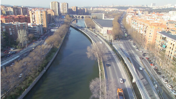
Рис. 4. Набережна річки Мансанарес до 2006 року. Іспанія

До 1960 року чисельність населення Мадрида перевищила 2,26 млн. люд., а 1970 року - досягла 3,15 млн. люд. У 70-ті роки Мадрид, як і всі великі міста Європи, потонув в автомобілях. Автомобіль обожнювався і передбачалося, що це єдиний перспективний вид транспорту - такий собі вінець творіння людини. У Мадриді, звичайно ж, розгортається активність з автомобілізації міста. Цінність бульварів у розумінні городян зникає, на їхньому місці зводяться широкі магістралі, розвивається система підземних та наземних автостоянок. Владою Мадрида на початок 2000-х було прийнято проект серйозної реконструкції шосе. Цей проект став частиною більш масштабної діяльності щодо зміни транспортної ситуації у всьому місті. Проект Madrid Río - це близько 650 га оновленої території, яка раніше була депресивним районом Мадрида. Ось, що було на набережній Мансанарес до 2006 року і що стало після закінчення реконструкції у 2011 році (рис. 4, 5, 6, 7).