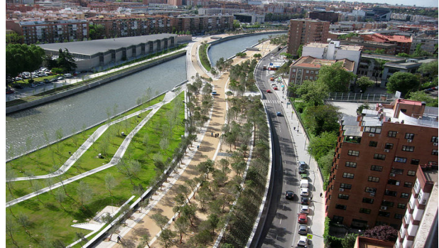
Рис. 5. Набережна річки Мансанарес, Мадрида