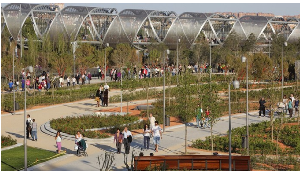
Рис. 6. Набережна річки Мансанарес, Мадрид