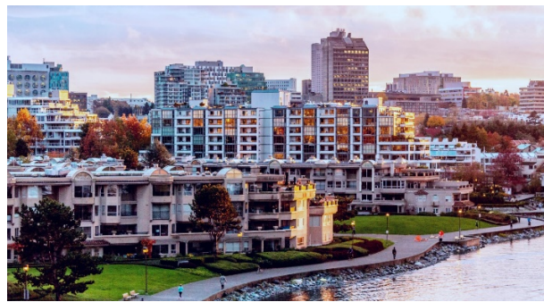
Рис. 2. Район Фолс-Крік, Ванкувер, Канада

До 50-х років минулого століття район затоки Фолс-Крік, що примикає до історичного центру Ванкуверу, був промисловим ядром міста. У 1960 році пожежа, що виникла на території деревообробної фабрики, стерла його з обличчя землі. Ідея міської влади прокласти по берегу затоки швидкісну автотрасу без обговорення з громадськістю натрапила на потужний опір впливових міських активістів. Підсумком багаторічних дебатів став Офіційний план розвитку, прийнятий в 1972 році. По ньому працюють і зараз. Причому упор в ньому робиться на максимальне розмаїття функцій, безпеку і комфорт міського середовища (рис. 2).