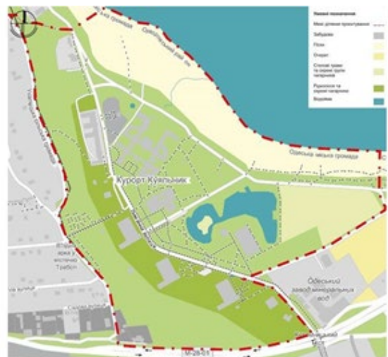
Рис. 3. Схема природного ландшафту курорту Куяльник

Композиційно ділянку можна розбити на головні та другорядні елементи, що працюють у тісному зв'язку. Так, перші створюють каркас, на якому розташовуються другорядні елементи. Для ділянки санаторію «Куяльник» характерним є поділ на дві нерівні частини завдяки головній осі – вул. Лиманній (рис. 3, 4).