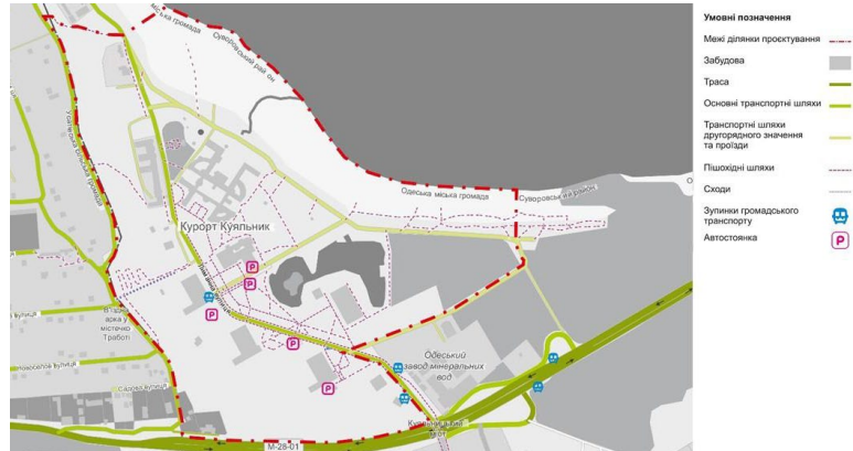
Рис. 2. Схема транспортно-пішохідних шляхів курорту «Куяльник»

Композиційно ділянку можна розбити на головні та другорядні елементи, що працюють у тісному зв'язку. Так, перші створюють каркас, на якому розташовуються другорядні елементи. Для ділянки санаторію «Куяльник» характерним є поділ на дві нерівні частини завдяки головній осі – вул. Лиманній (рис. 3, 4).