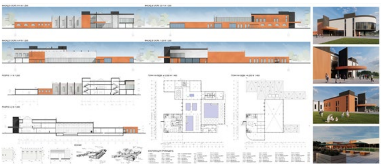
Рис. 7. Архітектурна частина дипломного проекту на ділянці курорту «Куяльник»