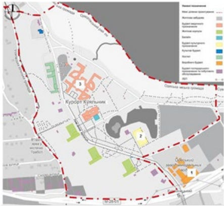
Рис. 1. Схема інфраструктури курорту «Куяльник»

узбережжя від основної ділянки санаторію. Основні пішохідні доріжки пронизують зони навколо житлових корпусів та поблизу поліклініки й палацу культури. У зонах позаду житлових корпусів та на самому узбережжі лиману ці шляхи є менш розвинутими. Втім варто зазначити, що пішохідні доріжки виконують не лише функцію горизонтальних, а подекуди й вертикальних зв'язків на території. Так у західній частині ділянки, що розглядається, пішохідні шляхи проходять скрізь схил та з'єднують його верхню та нижню точки.