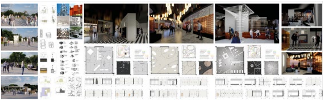
Рис. 6. Дизайнерська частина дипломного проекту на ділянці курорту «Куяльник»