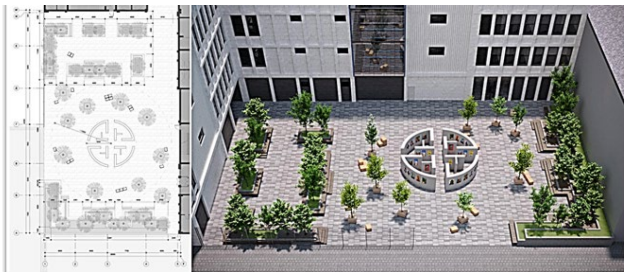
Рис. 5. Формування громадсько-виставкового комплексу в історичному середовищі м. Одеси. Дизайн внутрішнього двору. Пропозиції – архітектор І. Лесів

Засоби ландшафтного дизайну – його елементи – традиційні (озеленення, благоустрій, малі архітектурні форми тощо) і новітні, що створюються на основі сучасних технологій, матеріалів, освітлення, а також різні види сучасного мистецтва (кінетичне мистецтво, стріт-арт, паблік-арт, ленд-арт тощо) [10] виступають системоутворюючими елементами відкритих міських просторів (рис.5).