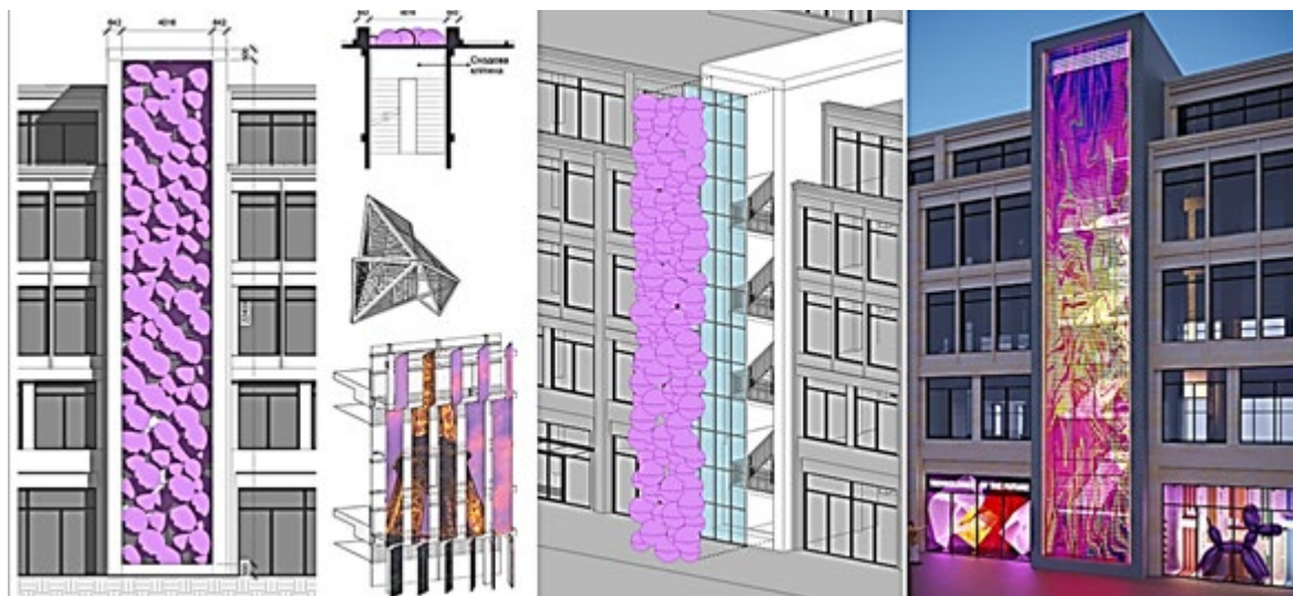
Рис. 4. Громадсько-виставковий комплекс в історичному середовищі м. Одеси. Пошуки рішення фасадів. Пропозиції – архітектор І. Лесів

Історико-генетичний код зумовлює архітектурно-художнє утворення стилю на рівні окремого об'єкту як його «локальний архітектурно-художній стиль», спрямований на виявлення унікальності і художньої індивідуальності (рис. 4).