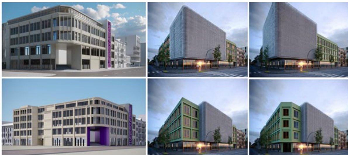
Рис. 3. Громадсько-виставковий комплекс в історичному середовищі м. Одеси. Пошуки фасадних рішень. Пропозиції – архітектор І. Лесів

На рівні архітектури – об'ємно-просторового рішення – розглядається створення дизайн-коду на основі історико-генетичного аналізу – своєрідного еволюційного дослідження – історико-генетичного коду міста (рис. 3).