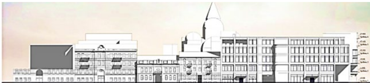
Рис.1. Громадсько-виставковий комплекс в історичному середовищі м. Одеси. Розгортка по вулиці лейтенанта Шмідта. Пропозиції – архітектор І. Лесів

Забудова цієї частини міста виникла ще в ХІХ столітті і носить характер невеличких кварталів з будівлями по периметру і внутрішніми дворовими просторами, що певним чином зумовлює формування нового об'єкту в її структурі (рис. 1, 2).