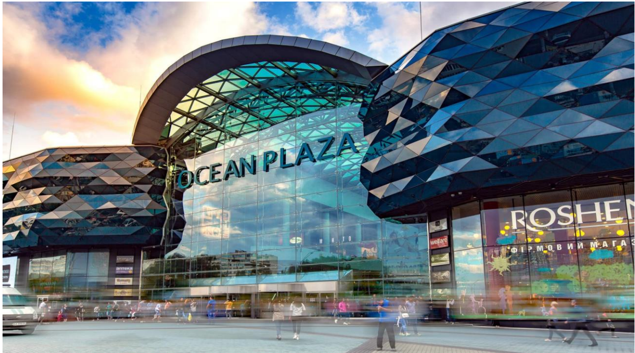
Рис. 3. Комплекс «Ocean Plaza», м. Київ

Відповідно до вище сказаного, слід відмітити основні тенденції сучасної архітектури України, які розвиваються у напрямках: