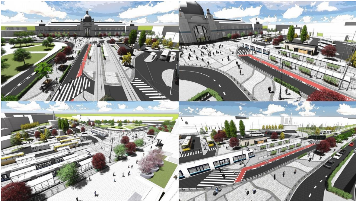
Рис.1. Привокзальна площа, м. Львів