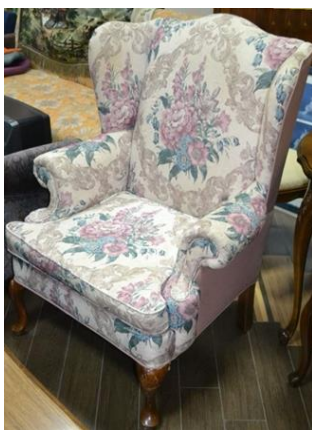
Рис. 8. Крісло

Сьогодні гобелен активно займає позиції в фешн-індустрії. Заслужують на захоплення пальта (рис. 9) і костюми, сукні, оригінальні пояси, рукавички, косметички з цієї дивовижної тканини. Оригінально і красиво виглядають туфлі та сумки (рис.10) з цього матеріалу, до того ж вони по міцності не поступаються шкіряним аналогам. Сумка з гобелена, а також косметички, пояси (рис.11) – must-have сучасної модниці [3].