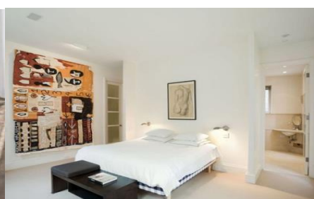
Рис. 7. Вінтажний