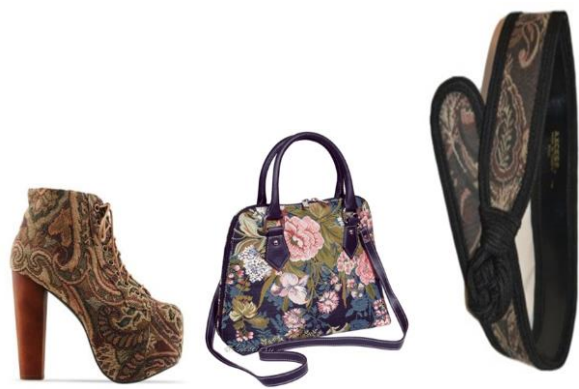
Рис.10. Туфля та сумка