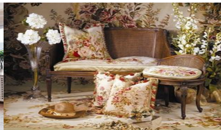
Рис. 4. Прованс

Одним з найпопулярніших стилів є Прованс (рис. 4). Його асоціюють з морем, сонцем, природою. Для естетики Провансу знадобляться рослини як засушені, так і живі, штори з рюшами, оригінального драпірування, безліч подушок і стеганих покривал. Для класичного стилю (рис. 5) необхідно багато простору і високі стелі. Хороший паркет, порцелянові вироби, книги, великі дзеркала і скульптури і при цьому ніякої перевантаженості деталями. Тут ніяк не обійтися без оксамиту і відповідних гобеленових тканин. Для мінімалізму (рис. 6) навпаки, необхідна тільки одна колоритна річ в інтер'єрі. Для прикладу, яскраві червоні подушки на дивані, або строкатий килим посеред кімнати. І саме це послужить безпрограшній версії. Вінтажний стиль (рис. 7) вважається елегантним і жіночним. Для нього необхідні речі, як би з нальотом старовини. Це і меблі, і інші речі інтер'єру, які вже прослужили достатньо часу. Найоригінальнішим з варіантів гобелена вважають одноманітний геометричний малюнок, обраний за стилем [1].