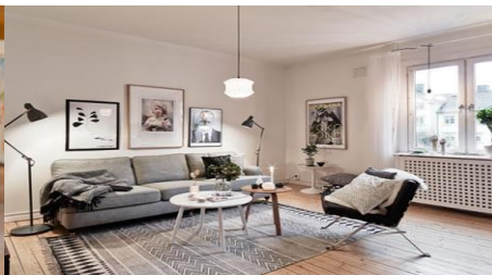
Рис. 3. Скандинавський