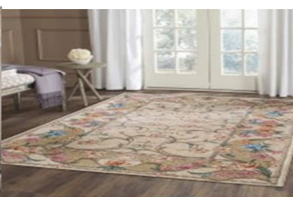
Рис. 6. Мінімалізм