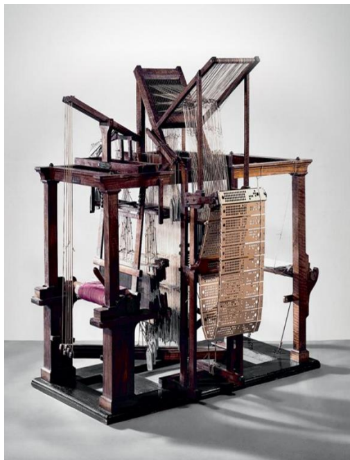
Рис.1. Жакардовий верстат

Історія виникнення терміну. Сам термін з'явився у Франції з відкриттям мануфактури Гобеленів. При цьому фахівці говорять про те, що гобеленом слід вважати тільки продукцію цієї мануфактури, все інше – це шпалери. Разом з тим, в даний час цим терміном називають будь-яке ткане полотно. Своє сучасне найменування гобелени отримали лише в XII столітті, і воно пов'язане із засновником цього виробництва Жілем Гобеленом. Уродженець Реймса заснував у паризькому передмісті фарбувальне виробництво. Його справи пішли дуже успішно, і за легендою, заснованою на звучанні цього прізвища («гоблін»), реміснику допомагали в роботі надприродні істоти. Згодом родина Гобелен зайнялася ще й виготовленням килимів, розбагатіла і продала свої майстерні у власність короля.