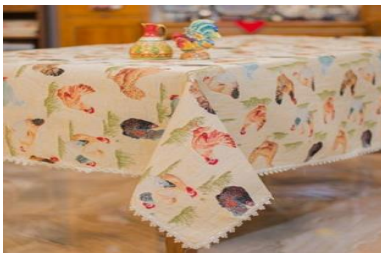
Рис. 2. Кантрі

Стилі. Виділяють кілька стилів гобеленів. Гобелен в східному стилі – неповторний. Він наповнений якимось філософським поглядом на життя, такий же витончений, як гнучкий стан танцівниці. Стиль кантрі (рис. 2) ідеально підійде до дерев'яної підлоги світлих тонів, макраме та плетених елементів, розписного посуду і старовинних речей. Дуже часто, використовуючи такий стиль, одну стіну повністю відводять для каміна, а інші покривають деревом. Така комбінація натуральних відтінків створює дух рідного дому. Скандинавському стилю (рис. 3) прийнятна природна простота. Для цього підійдуть прості меблі з хорошого дерева і стіни світлих тонів. Використовуйте зеленуватий колір або беж – не треба вгадувати, бо декорування тут практично не знадобиться, це самобутній стиль.