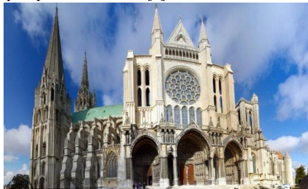
Рис. 4. Собор Реймської Богоматері

З кінця XII ст. Провідним стає породжений Світові архітектурні пам'ятки готичного стилю міським європейським життям готичний стиль. За легкість і ажурність його називали застиглою або безмовною музикою, «симфонією в камені». На відміну від суворих, монолітних, солідних романських храмів, готичні собори прикрашені різьбленням і декором, безліччю скульптур, вони повні світла, спрямовані в небо, їх вежі піднімалися до 150 м.