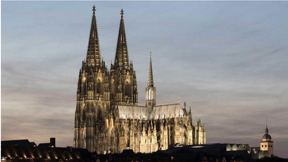
Рис. 1. Ансамбль міського собору

світських сил – міських, торговельних і ремісничих, а також придворно-лицарських кіл. Інтенсивно розвивалися містобудування і цивільна архітектура. Міські архітектурні ансамблі включали культові і світські будинки, зміцнення, мости, колодязі. Головна міська площа часто оббудовувалася будинками з аркадами, торговельними і складськими приміщеннями в нижніх поверхах. Від площі розходилися головні вулиці; вузькі фасади 2-, рідше 3-поверхових будинків з високими, фронтонами вибудовувалися уздовж вулиць і набережних. Міста оточувалися могутніми стінами з багато прикрашеними проїзними вежами. Замки королів і феодалів поступово перетворювалися в складні комплекси фортечних, палацевих і культових споруджень. Звичайно в центрі міста, пануючи над його забудовою, знаходився замок або собор, який ставав осередком міського життя. У ньому поряд з богослужінням улаштовувалися богословські диспути, розігрувалися містерії, відбувалися збори городян. Собор мислився свого роду зводом знання, символом Вселеної, а його художній лад, що сполучив урочисту велич з жагучою динамікою, достаток пластичних мотивів зі строгою ієрархічною системою їхньої субпідрядності [2]. Смілива і складна каркасна конструкція готичного собору (рис. 2), що втілила торжество сміливої інженерної думки людини, дозволила перебороти масивність романських будівель, полегшити стіни і зводи, створити динамічну єдність внутрішнього простору.