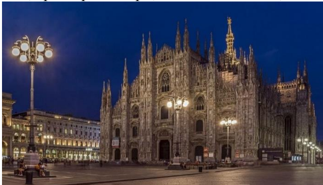
Рис. 3. Кельнський собор

У готиці відбувається збагачення й ускладнення синтезу мистецтв, розширення системи сюжетів, у якій відбилися середньовічні предствлення про світ. У готиці органічно переплелися ліризм і трагічні афекти, піднесена духовність і соціальна сатира, фантастичний гротеск і фольклорність, гострі життєві спостереження [3]. У пізній готиці одержали поширення скульптурні вівтарі в інтер'єрах, що поєднують дерев'яну розфарбовану і позолочену скульптуру і темперний живопис на дерев'яних дошках. Склався новий емоційний лад образів, що відрізняється драматичною (нерідко екзальтованою) експресією, особливо в сценах страждань Христа і святих, переданих з нещадною правдивістю. З'явилися розписи на світські сюжети. У мініатюрах (часословах) намітилося прагнення до одухотвореної людяності образів, до передачі простору й обсягу. До кращих зразків французько готичного декоративного мистецтва належать дрібна скульптура зі слонової кістки, срібні релікварії, лиможська емаль, шпалери і різьблені меблі [1].