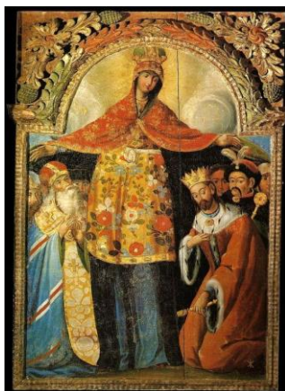
Рис. 2. «Покров Богородиці» із зображенням Богдана Хмельницького і архієпископа Лазаря Барановича. Дошка, різьблення, темпера, олія, сріблення, золочення. 88,5x60,5 см

Окремо варто зазначити такий тип ікони, як Покров Пресвятої Богородиці або Протекторітіса (Захисниця, Заступниця). Вона має велике значення в Україні оскільки у запорозьких козаків був особливий культ Богородиці-Покрови, як заступниці та захисниці від ворога. Головна церква завжди була на честь Покрови. Зображували її й на хоругвах, під якими козаки виступали в походи, а перед кожним походом навколішки ставали на молитву до Пресвятої Богородиці. В часи Гетьманщини ж виникає новий тип ікони – «Козацька Покрова» (рис. 2).