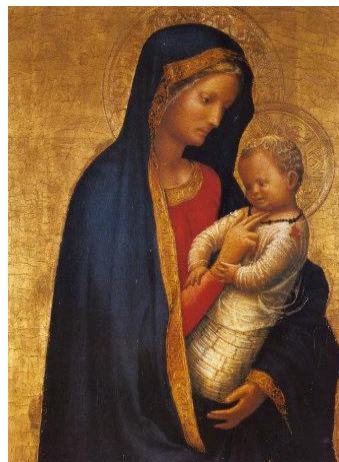
Рис. 5. «Madonna del solletico». Мазаччо

Високе Відродження являється кульмінаційною точкою всього періоду Ренесансу. Воно зберігає в собі знання попередників і підсумовує їх, коли ж до цього була тенденція активних пошуків і відкриттів. В цей період помітно прослідковується вплив античності і гуманізму, що на той час був провідною ідеєю. Вплив релігії падав, зростала світська культура і людина стала перебувати у центрі уваги. Однією з особливостей художників цього періоду було те, що вони втілювали свої погляди в роботах. За допомогою спостерегання вони створювали "ідеальних жінок", гармонічно поєднуючи різні риси своїх сучасниць (рис. 6).