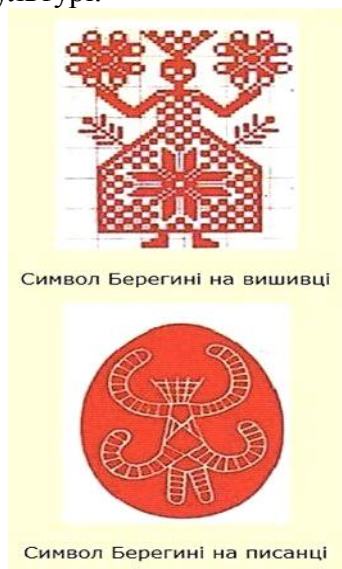
Рис. 1. Ілюстративні приклади застосування символів Богині Березині

Вступ. Віра є характерною людською ознакою, що прийшла до нас з давніх-давен. Для давніх слов'ян важливу роль посідала Богиня Березина – богиня добра і захисту людини, дух-захисник або уособлення материнства, жіноцтва. Її зображення (рис. 1) використовували як захист оселі, родинного багаття, насамперед малих дітей від хвороб та інших злих сил. З приходом християнства, символічне значення Березині було перекладено на образ Богородиці, яку також зображають із піднятими до неба руками. Таким чином хочу підвести до теми Богородиці, її значення та різноманітність сприйняття одного і того самого образу у західній та східно-європейській культурі.