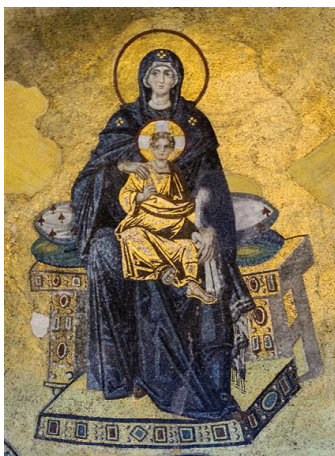
Рис. 3. «Мозаїка Богородиці і Дитятка в апсиді Собору Святої Софії», Візантійські мозаїки, бл. 867 р. 46x37,5 см

Досить звичний для нас вигляд святих бере свій початок у Візантії, яка мала вплив на всі православні країни. Візантійський стиль характеризується важкою стилізацією, надзвичайною виразністю ліній, використанням сталих художніх стереотипів і багатих кольорів, зокрема, золота. Середньовічний світ та його традиції відрізняються відмовою від спадщини Античності і перевага у бік біблійних мотивів в живописі і скульптурі. Також, в цей час потужний розвиток мали фрески та мозаїки (рис. 3), що стали характерною рисою візантійських, та загалом середньовічних традицій. Типовою ознакою середньовічних витворів мистецтва є двомірність, площинне зображення сюжетів. Головним у зображенні були очі (дзеркало душі), а фігури часто були ніби відірваними від землі. Із живопису на довгі роки зник пейзаж.