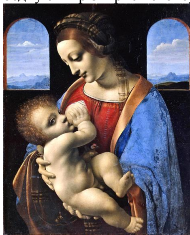
Рис. 6. «Madonna Litta». Леонардо да Вінчі. Полотно, темпера. Бл.1490 р. 33x42 см

Високе Відродження являється кульмінаційною точкою всього періоду Ренесансу. Воно зберігає в собі знання попередників і підсумовує їх, коли ж до цього була тенденція активних пошуків і відкриттів. В цей період помітно прослідковується вплив античності і гуманізму, що на той час був провідною ідеєю. Вплив релігії падав, зростала світська культура і людина стала перебувати у центрі уваги. Однією з особливостей художників цього періоду було те, що вони втілювали свої погляди в роботах. За допомогою спостерегання вони створювали "ідеальних жінок", гармонічно поєднуючи різні риси своїх сучасниць (рис. 6).