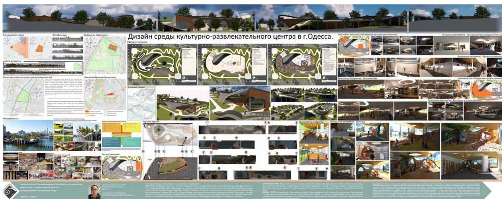
Рис. 7. Ву Минлі. Культурно-розважальна функція з бібліотекою. Додаткове обводнення. Дизайн-ідея – скрита архітектура. Шлях над водою