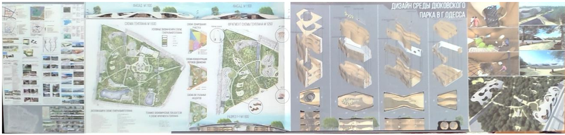
Рис. 9. Драган М. Розробка дозвоільно-розважального комплексу для молоді. Дизайн-ідея – Дерев'яні лабіринти