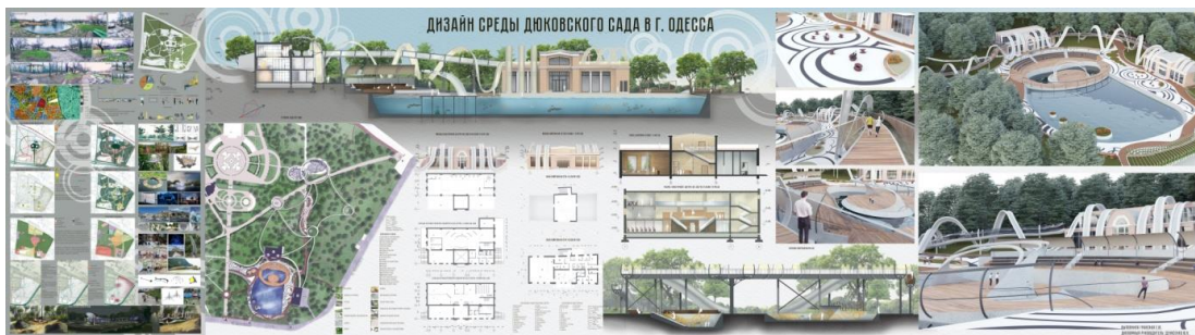
Рис. 6. Гранська К. Розробка культурно-розважальної функції над озером. Дизайн-ідея – парковий серпантин