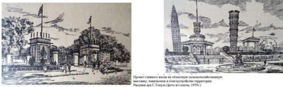
Рис. 3. Парк Перемоги (1955 р.)

Відбувся розквіт, а також розширення функцій: Дитячий клуб «червоні маки», гуртки «природа та фантазія», зоології, квітництва, художньої самодіяльності, «чарівна палітра», фотогурток, жіночий клуб «Червона гвоздика», бібліотека, каток, водна станція з прокатом човнів. Проекти самодіяльного благоустрою району. Додаткові функції: Спортивна Виставкова Розважальна Культурного розвитку та дозвілля.