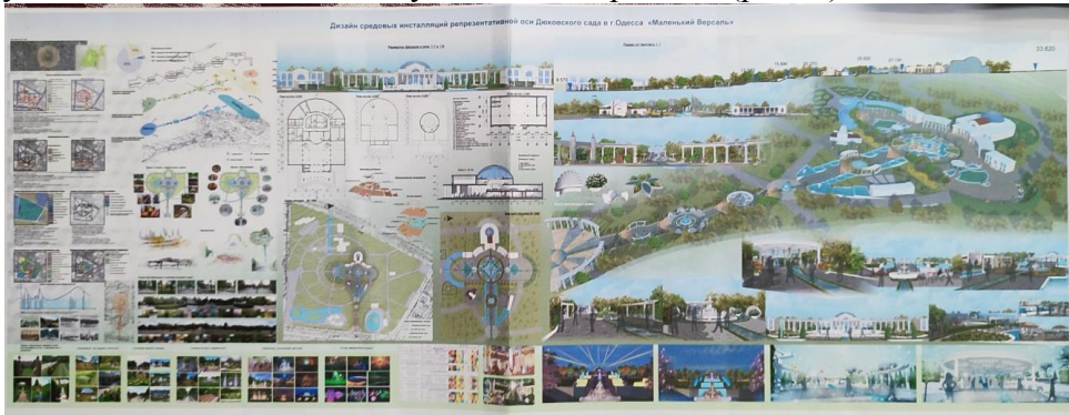
Рис. 5. Сарий К. Виявлення центральної історичної вісі. Дизайн ідея – маленький Версаль