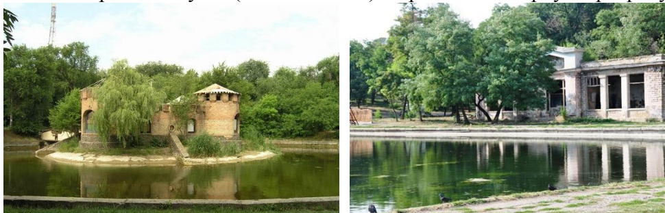
Рис. 4. Парк Перемоги (кін. 1970-х рр.)

7. Початок повторного забуття (кінець 1970-х): переведення парку на розрахунок (рис. 4)