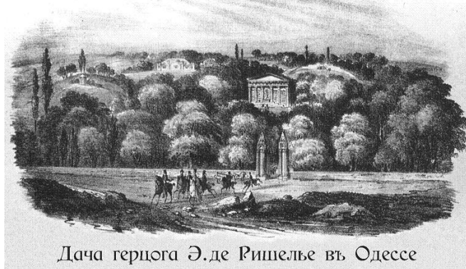
Дача герцога Э.де Рішельє в Одессе