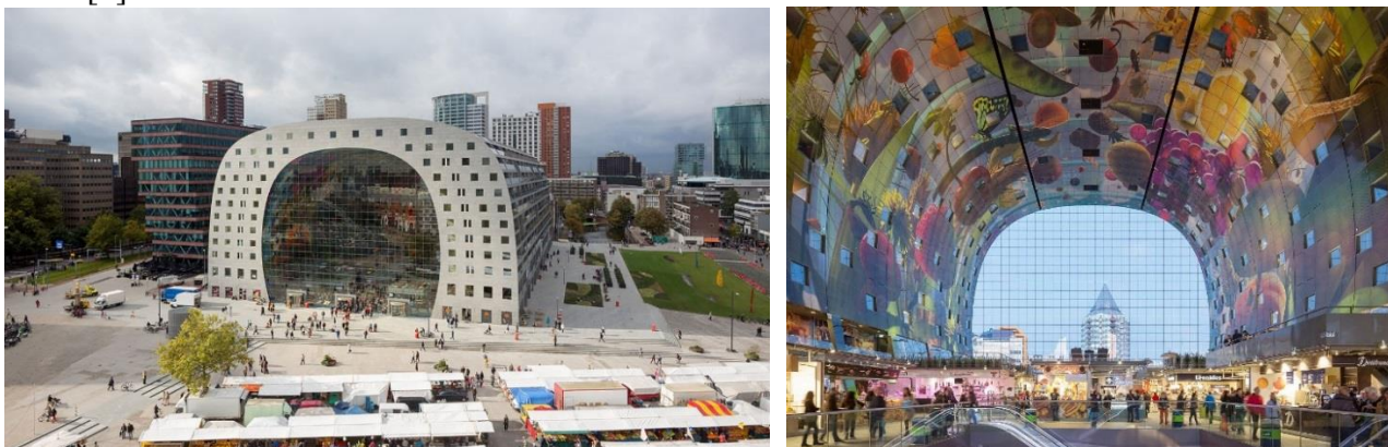
Рис. 5. Ринок Марктхол від бюро MVRDV зовні та зсередини

В новому столітті місто та його мешканці втратили інтерес до широкомасштабних міських проєктів, стратегічного планування та обговорення силуету міста. Натомість людей почала хвилювати якість життя. Муніципалітет звернувся до послуг Яна Гейла, відомого голландського експерта із проєктування суспільних просторів. Якщо у 1950-х увагу приділяли зонуванню та вуличній мережі, то тепер – пішохідним потокам та суспільним просторам. У 2010-х з'явилися нові програми, які вплинули на розвиток громадських просторів Роттердама. З поглядів безпеки продуктів харчування, більша частина відкритого ринку на площі Бінненротте переїхала до критого ринку Марктхол (рис. 5). На думку Рема Колхаса з бюро ОМА, яскрава архітектура прямо пов'язана з вдалим відновленням після війни[2].