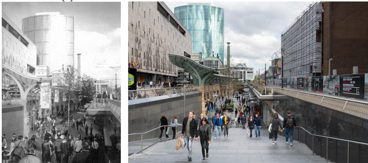
Рис. 4. Галерея Коопгоот в 1990-х та 2010-х рр.

В 1990-х рр. почався будівельний бум, поверх «Базового плану реконструкції» поступово наростав новий прошарок міської забудови. Нові хмарочоси заслонили собою будинки 60-х. Архітектура часів реконструкції поступилася місцем новим спорудам. Торгова галерея «Коопгоот» (рис. 4), побудована за проектом Джона Джерде, з'єднала торгову вулицю Лайнбан зі східною частиною центру. Роттердам намагався відповідати образу сучасної європейської метрополії, трансформуючись та розвиваючи характерні риси міського життя [2].