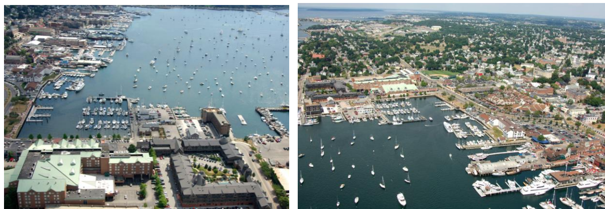
Рис. 4. Newport Yacht Club, Ньюпорт, Род-Айленд, США

Висновки та результати. Реновація об'єктів яхт-клубів у структурах прибережної зони є завданням, яке потребує виконання ряду важливих принципів. Успішні проекти реновації яхт-клубів з урахуванням цих принципів забезпечують необхідний рівень безпеки, комфорту