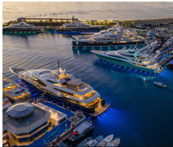
Рис. 1. Port Hercules, Монако

2. «Royal Hong Kong Yacht Club». Легендарний Королівський яхт-клуб, розташований у прибережній зоні Гонконгу, у центрі гавані Вікторія, є іконою у світі вітрильного спорту. Нинішній будинок клубу був побудований у 1939 р. та введений в експлуатацію в 1940 р., але був закритий після японського вторгнення в Гонконг у грудні 1941 р. Сьогодні будівля клубу на острові Келлетт залишається в основному «штаб-квартирою» РНКУС і містить багато історичних пам'яток.