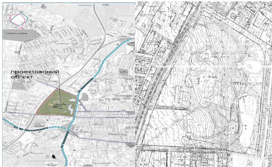
Рис. 2. Ситуаційна схема та геоїдоснова Дюківського саду