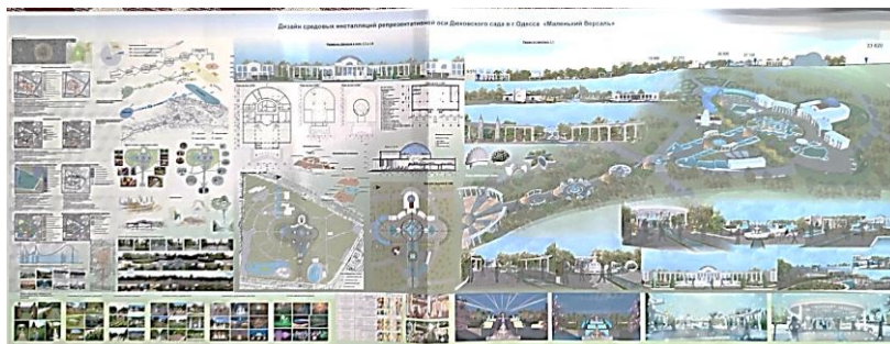
Рис. 5. Проект Сарій К. з облагородження Дюківського саду

Вісь поєднує майже усі зони парку, може забезпечити різний темп та характер руху (пішохідний, електротранспорту, гужовий тощо).