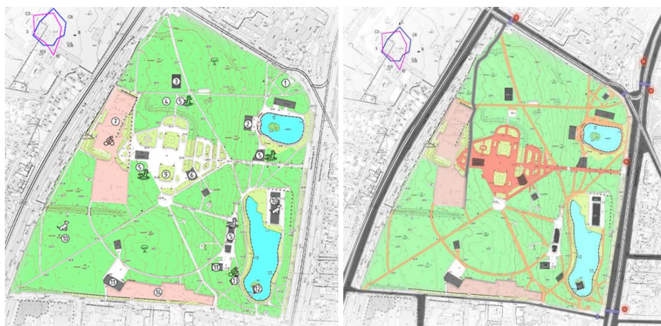
Рис. 3. Опорний генплан та структурна схема зв'язків Дюківського саду

Структурно-композиційний потенціал може бути представлений таким чином: