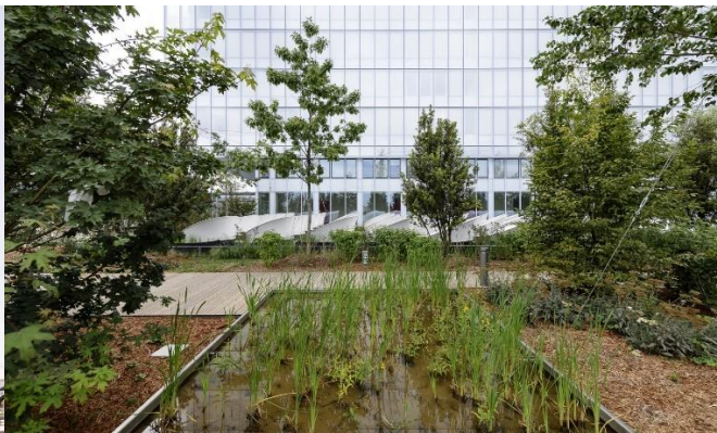
Рис. 5 Головний фасад суду у Парижі