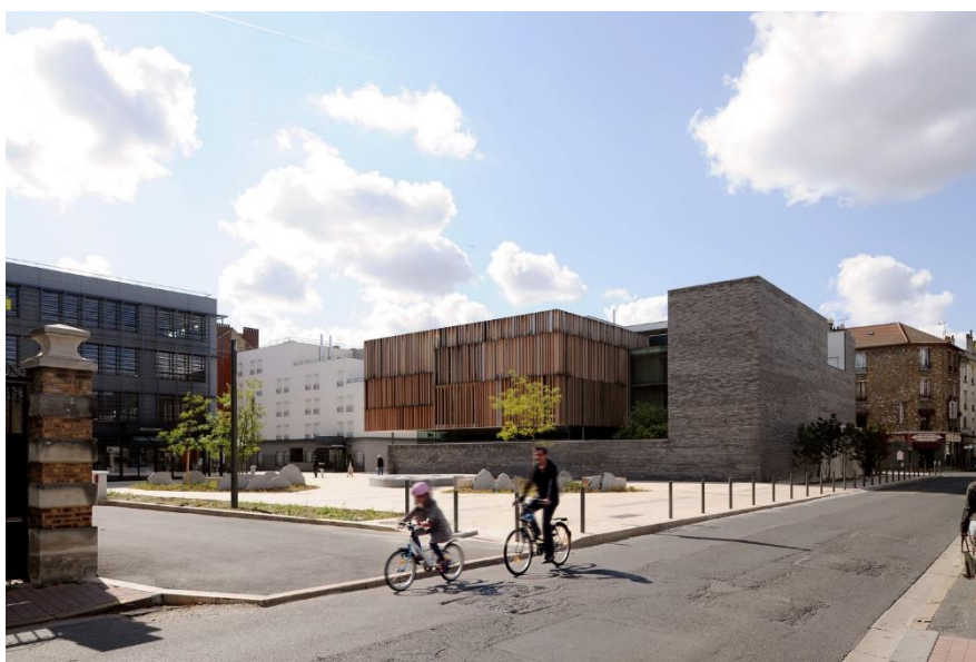
Рис. 4 Регіональний суд та промисловий трибунал в Монморенсі, Валь-д'Уаз, Іль-де-Франс, Франція

Будівля суду від бюро Dominique Coulon & associés в Монморенсі (рис. 4) відображає собою «скромне» правосуддя. Насамперед, це невибаглива громадська будівля, гармонічно інтегрована у міське оточення – команда бюро обрала цеглу як облицювальний матеріал, приближуючи суд до оточуючої архітектури. Вони відмовляються від традиційної симетричності, яка переслідує більш «класичні» варіанти судових установ, використовуючи виріз у вигляді бокової западини на головному фасаді. Зовні ця будівля не сприймається судовою установою, завдяки чому не завдає шкоди оточуючій їй спокійній та скромній забудові муніципалітету [4].