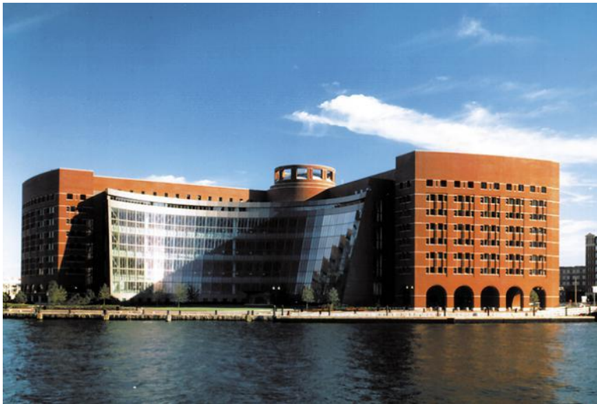
Рис. 1 Федеральних суд ім. Джона Джозефа Моклі, Бостон, штат Массачусетс, США

Загалом у сучасному проектуванні судів потрібно розглядати декілька аспектів, які напряму впливають на дизайн та архітектуру у цілому. Саме гнучкий дизайн, який здатний надати можливість вертикального та горизонтального розширення будівель, та адаптації основних та допоміжних приміщень суду при можливій зміні функціонального призначення. У купі з цим, у проектуванні сучасних судів необхідно передбачити впровадження сучасних технологій. Їх інтеграція, перш за все, має відповідати вимогам громадян що до отримання повних та справедливих послуг від державної установи.