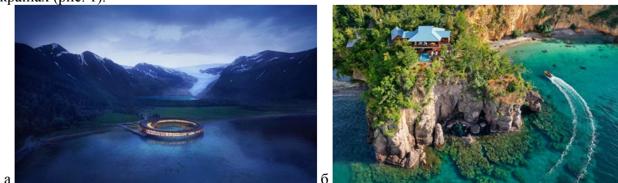
Рис. 1. Найкращі еко-готелі світу

Сьогодні еко-готелі стають все більш популярними та відкриваються повсюдно, але їхня частка в готельному сегменті ще не велика. Частка екоготелів у країнах Західної Європи та США не перевищує 20% від загальної кількості готелів. Перший екологічний готель відкрився в Мілані – це чотиризірковий готель «Hotel Scala», який розташований у семиповерховому будинку замку, збудованого наприкінці XIX століття. Для контролю за температурою повітря та подачею гарячої води в готелі застосовується спеціальна система відновлення енергії з використанням відновлюваних джерел. Так, готель не використовує паливо і тому не викидає до атмосфери таку забруднюючу речовину, як CO 2 . Свого часу найкращі еко-готелі світу були відкриті у Швейцарії, Великій Британії, Чехії та в інших країнах (рис. 1).