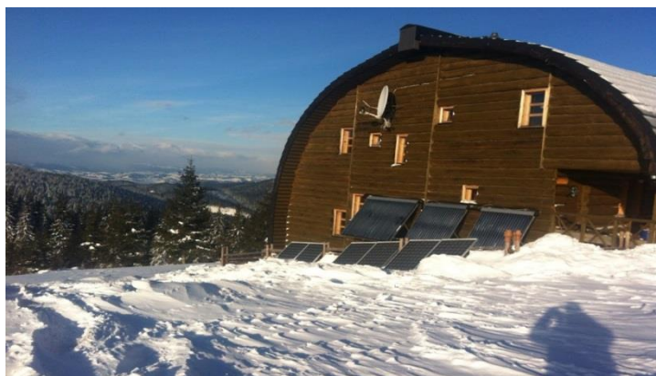
Рис. 2. Гірський готель «Ковчег», Україна

У Гамбурзі, який відомий своїми заповідниками, парками і має статус європейської «зеленої» столиці Європи, туристи, які віддають перевагу екологічному формату подорожей, можуть обирати такі готелі, як Park Hyatt Hamburg або Okotel Hamburg [2]. В Україні екологічний сертифікат отримав гірський готель «Ковчег» (Чернівецька обл., вершина гори Мегура) (рис. 2).