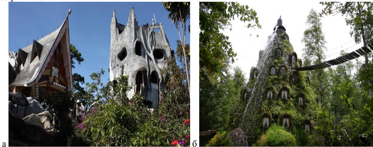
Рис. 3. Приклади екзотичних еко-готелів а – готель Hang Nga (В'єтнам); б – готель «Чарівна гора» (Чилі)

Говорячи про планувальні рішення, деякі екзотичні рішення присутні у проектуванні таких готелів: еко-готель у формі дерева Hang Nga (В'єтнам) (рис. 3, а); готель «Чарівна гора», що формою нагадує гору, по якій біжить справжній водоспад (Чилі) (рис. 3, б); готель «Сон на дереві» (Німеччина), номери якого підвішені до гілок та стовбурів довколишніх дерев тощо.