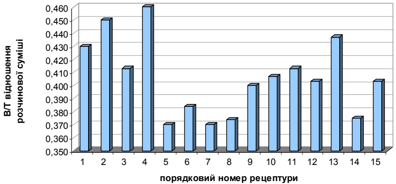
Рис.1. Водотверде відношення при розпльві розчинової суміші по віскозиметру Сутгарда - 240мм

З експериментальних даних та гістограм на всьому діапазоні досліджених факторів значення V/T коливається від 0,37 до 0,46. По графіку достатньо чітко відокремлюються рецептури з низьким водотвердим відношенням, завдяки вмісту в розчинової суміші максимальної кількості пластифікуючої добавки.