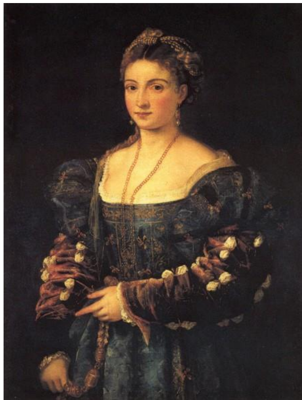
Рис. 4. «Портрет прекрасної дами» (Тиціан, 1535р.)

Висновок. Отже, сучасне мистецтво – це складне та багатогранне явище, яке постійно розвивається. Твори можуть бути складними для розуміння, але вони пропонують новий погляд на реальність та емоції головних героїнь. На відміну від художників епохи Відродження, які намагалися приховати правду від глядача сучасники показують повною мірою, що жінки насамперед всі унікальні, що кожна жінка чи дівчина це і є витвір мистецтва. «Кожна митець використовує свої неповторні авторські прийоми для художнього висвітлення цього вічного образу».