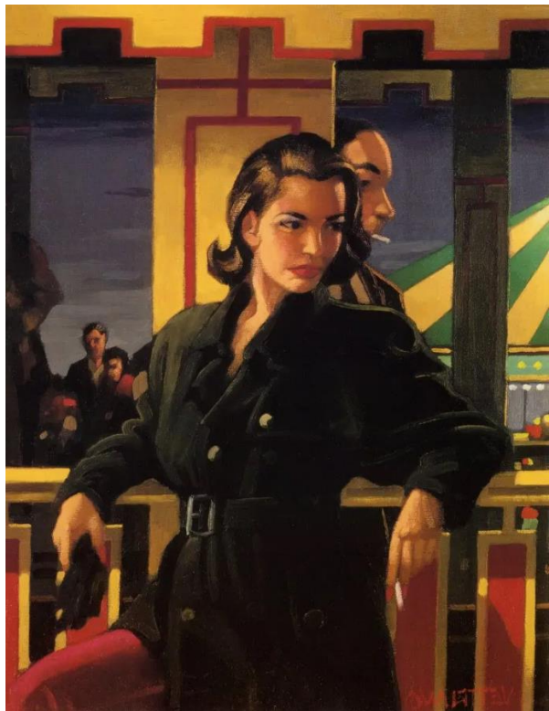
Рис. 2. Веттріано Джек «Головна голова IV»

канони краси при зображенні ідеальної жінки. Жінки часто зображувались як алегорії чеснот, муз, богинь. Їхні образи несли в собі глибший сенс, символізуючи певні цінності та ідеї. Жінки у епоху Відродження були обмежені майже всім, по-перше їхнім основним завданням було ведення домашнього господарства, народження та виховання дітей. Освіту отримували не всі, деякі жінки із заможних сімей мали доступ до освіти. Епоха Відродження стала періодом, коли почали з'являтися нові ідеї щодо ролі та місця жінки в суспільстві. Це стало початком довгого шляху до гендерної рівності.