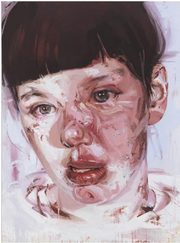
Рис. 1. Дженні Савіль «Червона зоряна пам'ятка»