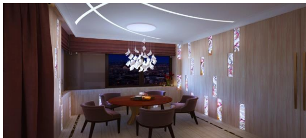
Рис. 12. Вставки у стінові та стельові панелі

Захоплюючись темою вітражів, автором статті було вирішено відтворити свій погляд на вписання кольорового скла в інтер'єрі зимового саду з вітражами Альфонса Мухи (рис. 13).