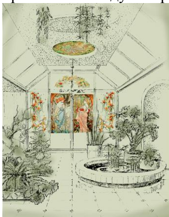
Рис. 13. Робота автора. Зимовий сад

Захоплюючись темою вітражів, автором статті було вирішено відтворити свій погляд на вписання кольорового скла в інтер'єрі зимового саду з вітражами Альфонса Мухи (рис. 13).