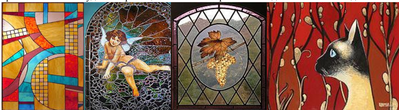
Рис. 4. Абстрактний Рис. 5. Античний Рис. 6. Візантійський Рис. 7. Авангардний

спікаються. Для ефектного результату просторової перспективи та об'єму, практикується використання градієнтних забарвлень окремих стекол. Спеціальні обробки дозволяють зробити скло вітража матовим, шорстким, сяючим, глянцевим або ж, і зовсім надати йому ефект «хамелеон». Будь-яке приміщення з таким вітражем виглядатиме неабияк модно.