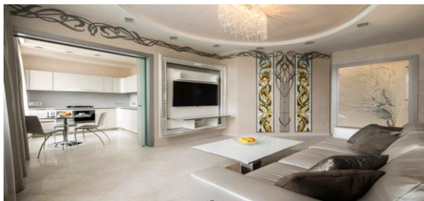
Рис. 11. Панно з куванням