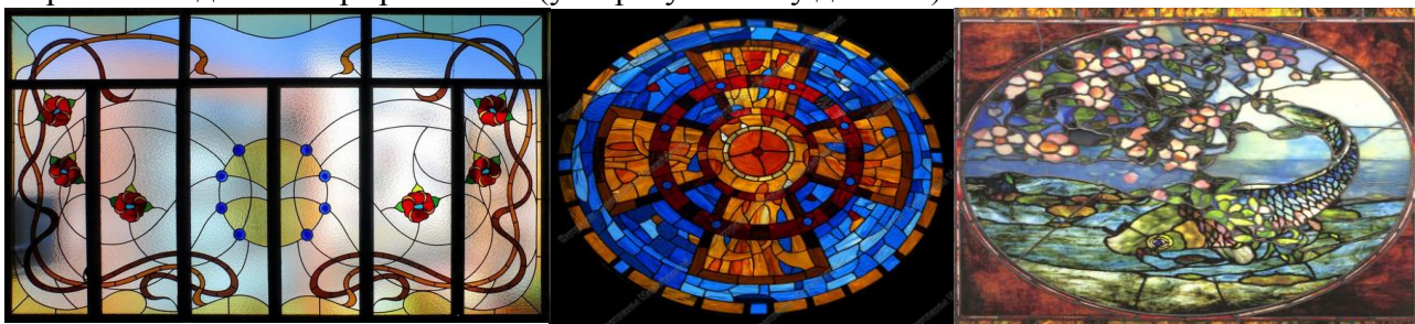
Рис. 1. Класичний

Вітражі епохи Модерн (рис. 3). В основі цього вітража лежить морська тема стилю. Всі лінії на вітражі окреслюють морську хвилю. Вітражу в стилі модерн характерні не чисті фарби, а півтони. Плавні і складні лінії, неабиякі контури решіток. Для даного вітража характерні приглушені тони, бліді відтінки, темне і пастельне скло. Вітражі в стилі модерн – талановитий художній витвір. Вони найменш вибагливі з усіх стилів вітражів до інтер'єру, оскільки підходять до будь-якого інтер'єру. Але варто відзначити особливо гармонійно цей вітраж виглядає в інтер'єрі хай-тек (ультрасучасному дизайні).