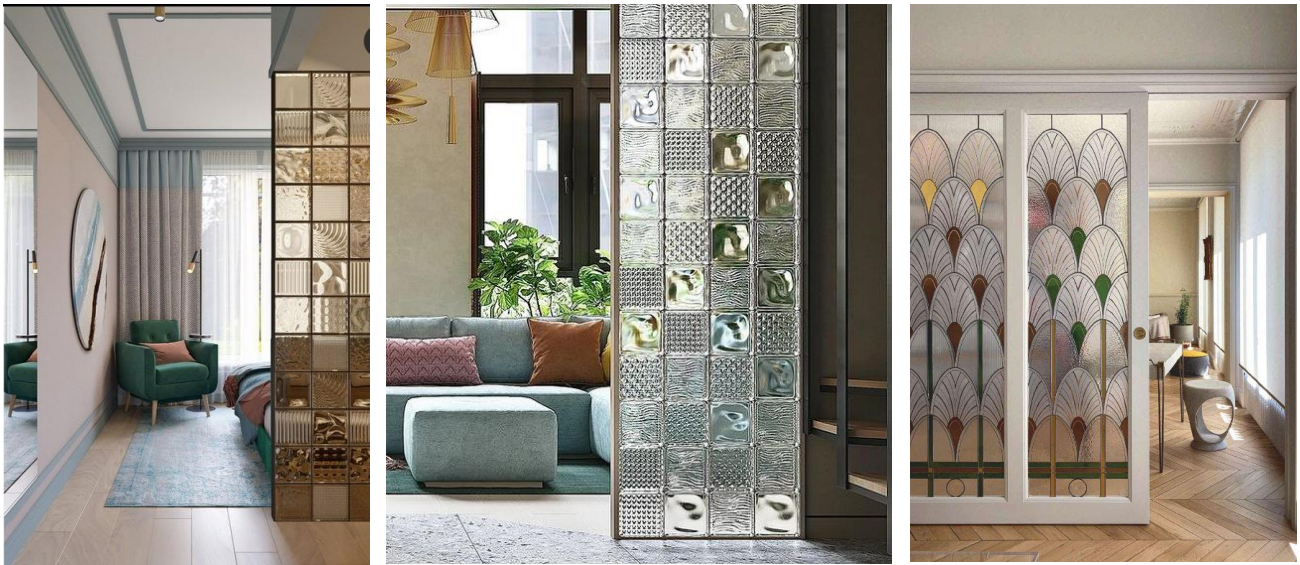
Рис. 2. Використання скла в інтер'єрі

Сьогодні свою популярність набирає використання склоблоків в інтер'єрі. Дизайнери застосовують склоблоки, створюючи з них практичні та естетичні конструкції з цього матеріалу. Конструкція склоблока нескладна – це порожня усередині «цеглина». Він забезпечує високі звукоізоляційні властивості і низьку теплопровідність, що допомагає зберігати тепло приміщень [4]. Такі конструкції створюють відчуття елегантності, а також пропускають багато природного світла, що має великий вплив на психологічне почуття людини, покращуючи настрій та надаючи енергії. Скляні перегородки та конструкції можуть зробити приміщення візуально більш просторим, відчиняючи простір і роблячи його більш привітним для очей. Це може знизити відчуття стисненості і покращити загальний настрій. Проте важливо враховувати дизайн і розташування конструкцій склоблоків. Наприклад, великі вікна з видом на природу можуть забезпечити відчуття спокою і гармонії, тоді як скляні перегородки, які дозволяють багато світла, але не забезпечують приватності, можуть викликати стрес.