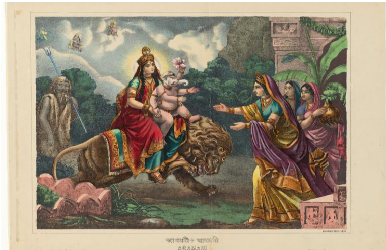
Рис. 5. Автор невідомий. Агамані, літографія, надрукована чорним кольором і розфарбована вручну аквареллю та вибірково нанесеною глазур'ю, 41 × 54,6 см