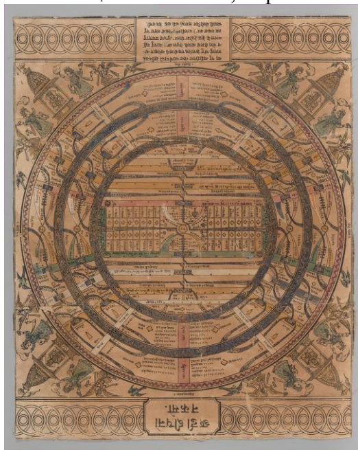
Рис. 4. Джайнська космологічна карта адхаїдвіпі, літографія 1900 р.

Індія має багату й різноманітну мистецьку спадщину, що охоплює низку технік і стилів, у тому числі й друковану графіку. Зв'язки між друкарством та Індією сягають корінням у різні контексти та періоди. Традиційне індійське мистецтво використовує різноманітні техніки гравюри, зокрема ксилографію, мідьоритм та ацетатний друк. Гравюру використовують для зображення священних текстів, міфологічних сцен і портретів [2].