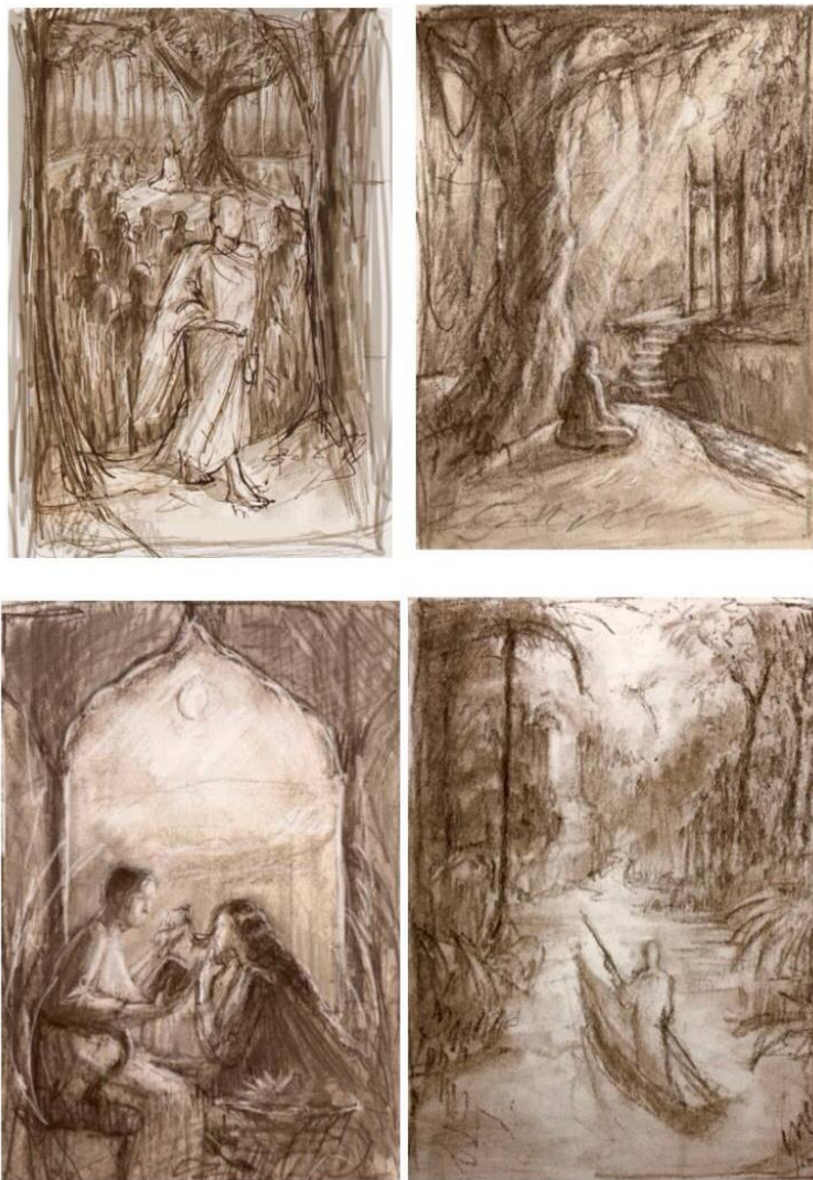
Рис. 6. Ескізи серії графічних ілюстрацій до роману «Сіддхартха» Гессе Г., олівець, папір

Метою на етапі розробок ілюстрацій є знаходження візуальних характерних засобів для передачі атмосфери літературного твору. В основі цієї серії лежить передання тісного зв'язку природи і людини, прагнення до гармонії в цілому завдяки використанню світла, домінуванню пейзажу над фігурами. Для досягнення бажаної фантазійності, мережовості зображення буде використано техніку сухої голки.