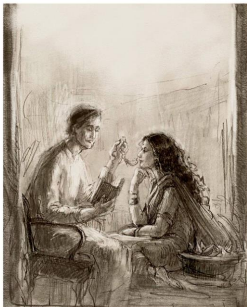
Рис. 6. Ескіз серії графічних ілюстрацій до роману «Сіддхартха» Гессе Г., олівець, папір