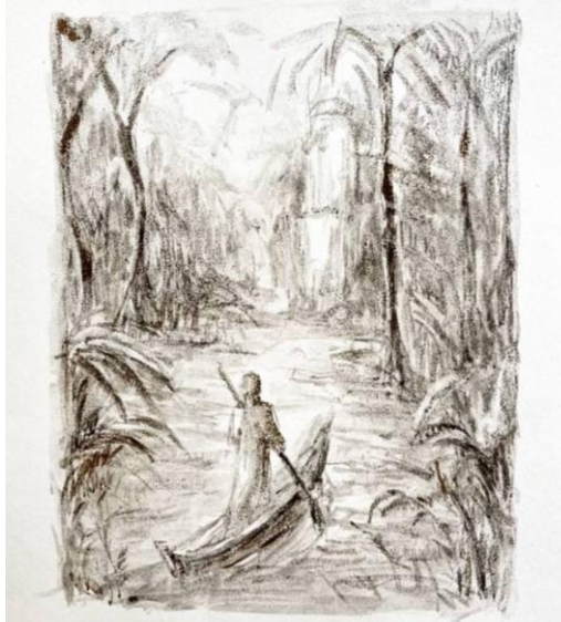
Рис. 7. Ескіз серії графічних ілюстрацій до роману «Сіддхартха» Гессе Г., акварельна монотипія

Висновки. Гравюрне мистецтво розвивається і в епоху сучасності. Друкарство продовжує залишатися популярним і важливим засобом для сучасних художників. Підбираючи візуальні засоби для відображення теми і настрою, митці використовують різноманітні техніки, такі як суха голка, літографія, ксилографія, ліногравюра тощо, щоб висловити свої творчі ідеї та графічні експерименти. Серед задач, які виконують ілюстратори, є вираз теми, настрою та емоції твору. Вони створюють картинку атмосфери, яка дозволяє читачу краще зрозуміти історію та емоції персонажів. Зосередження уваги на ролі гравюри у відтворенні культурних, міфологічних і літературних тем є вагомим для збереження та інтерпретації важливих аспектів культурної спадщини.