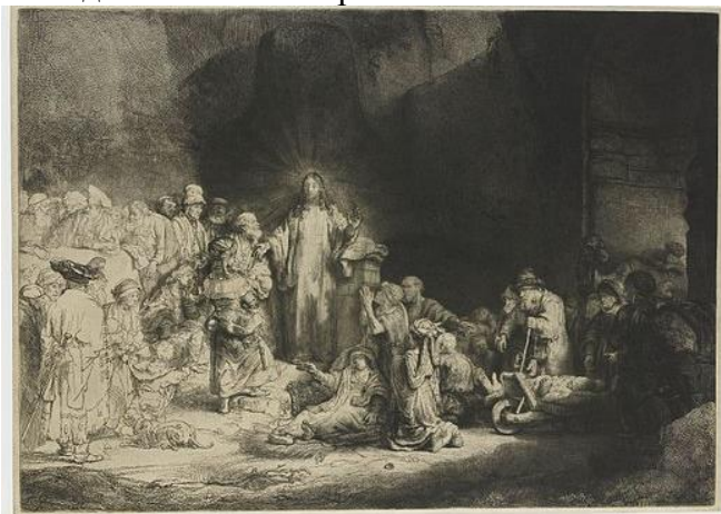
Рис. 2. Рембрандт ван Рейн. Христос, зцілюючий хворих, офорт 27,8 × 38,8 см 1643-1649 рр.

Естамп – це процес створення твору мистецтва шляхом друку, зазвичай на папері, а також на тканині, дереві, металі та інших поверхнях. Хоча «традиційне друкарство» охоплює процес виготовлення відбитків за допомогою ручних технік, а не фотографічних репродукцій творів візуального мистецтва, які зазвичай друкуються лише за допомогою електронних машин (принтерів), існує перехід між традиційним і цифровим друкарством, особливо в літографії [1]. Існує три способи репродукування: високий друк (опуклі рельєфні зображення), глибокий друк (вдавнені або жолобчасті зображення) і планографічний (літографічний) друк. Як пластини для високого друку використовують вертикально розрізану (ксилографія) або горизонтально розрізану (дереворит) деревину твердих порід, лінолеум (ліноліт), мідні, цинкові та сталеві пластини (гравюра на міді та металі), а також спеціальні літографські камені. Для кожного з методів виготовлення друкарських форм існує ціла низка технік гравіювання. У глибокому друці це суха голка, штриховий спосіб, меццотинто (чорний), акватинта, м'який лак, офорт Лавіса та інші техніки травлення. Репродукування зображень відоме вже багато років.