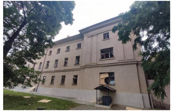
Рис. 1. Миколаївський обласний краєзнавчий музей. До та після влучення