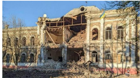
Рис. 3. Миколаївська гімназія імені Миколи Аркаса. До та після влучення