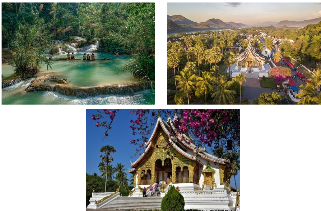
Рис. 2. Луанг Прабанг після співпраці з ЮНЕСКО

Угода про співпрацю між Францією та ЮНЕСКО активно сприяла розробці інтегрованих і скоординованих методологій управління та розвитку, які використовують економічні, соціологічні та культурні ресурси. Яскравим прикладом цього є спільний проект із захисту та розвитку міста Луанг Прабанг у Лаоській Народно-Демократичній Республіці. Місто Луанг Прабанг було внесено до Списку всесвітньої спадщини в грудні 1995 року. Розташоване в гористій північній частині Лаосу, біля злиття річки Меконг і річки Хан, Луанг Прабанг є колишньою королівською столицею одного з королівств Лаосу. Виняткова універсальна цінність об'єкта обумовлена тісним зв'язком між забудованим і природним середовищем, а також поєднанням лаоської міської структури – народної дерев'яної архітектури – та сітчастого плану, типового для урбанізму колоніальної епохи. Цінність рамок, визначених владою та запропонованих експертами, можна зрозуміти лише в тому, як нинішні мешканці роблять їх своїми та розділяють принципи. Саме в цьому сенсі збереження, покращення та управління містом Луанг Прабанг можна вважати успіхом [4] (рис. 2).