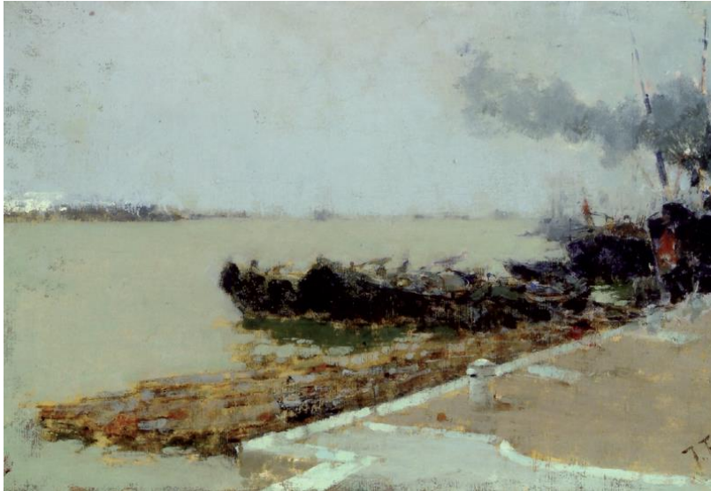
Рис. 1. Пленер. Франческо Філіпіні. Картина «Веніціанська лагуна». 1892 р.

попаданням у кольорі. Вчишся вірно передавати стан природи: ранок повинен виглядати як ранок, день – як день, а вечір – як вечір. Саме ця напружена та наполеглива праця покращує навички. Для будь-яких художників корисно проводити так час тому, що це дає розвиток спостережливості, зростання технічних навичок та розуміння світла, кольору і форми. Робота на пленері підштовхує студентів до самостійної праці та розвиває власний стиль. Крім того, вона надає можливість художникам зануритися в природу та відчутти атмосферу навколишнього середовища. Пленерне малювання не лише розвиває мистецтво, але і надає можливість художникам виразити свою унікальність та індивідуальність через їх твори [1].