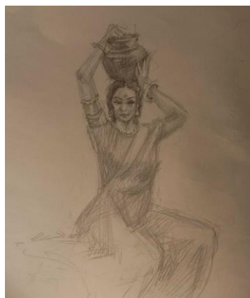
Рис. 4. Ескізи до композиції за мотивами індійської міфології «Легенда про Мохіні», олівець, папір

Висновки. Досліджуючи індійську міфологію в живописі відкриваємо для себе поєднання стародавніх традицій та сучасної інтерпритації. У різних культурах та історичних періодах міфологічний жанр слугував митцям потужним способом заглиблення в сюжети, що рясніють символізмом, архетипами й алегоріями. Переосмислюючи вікові міфи в сучасному світлі, митці не лише зберігають культурні наративи, а й вступають у динамічний діалог між минулим і сьогоденням. Таким чином, міфологічний живопис постає як провідник між часами, пропонуючи зануритись в багату колективну спадщину людства.