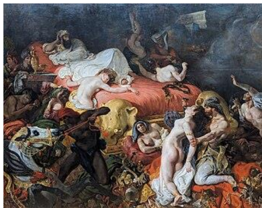
Рис. 2. Ежен Делакруа, Смерть Сарданапала. 1827р., Холст, масло. 392 × 496 см, Лувр, Париж

Наприкінці 19-го та на початку 20-го століть відбулося зростання рухів символізму та модерну, обидва з яких охоплювали містичні та духовні теми. Модерністський рух початку 20-го століття також засвідчив вплив індійської міфології на художників, які шукали нових форм вираження. Такі діячі, як Василь Кандинський і Пауль Клеє включили символічні й абстрактні елементи, що нагадують індійське мистецтво, у свої роботи. На сцені сучасного мистецтва індійська міфологія продовжує служити джерелом натхнення для художників у всьому світі. Художники з різним походженням спираються на індійські наративи та символи, або вшановуючи її багату культурну спадщину, або як засіб залучення до універсальних тем духовності та людського досвіду [4]. Дослідивши теоретичний та практичний матеріал, отримані знання було використано на етапі перших розробок до дипломної роботи композиції за мотивами індійської міфології «Легенда про Мохіні».