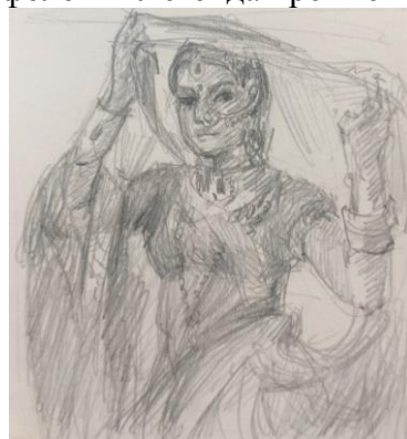
Рис. 3. Ескізи до композиції за мотивами індійської міфології «Легенда про Мохіні», олівець, папір