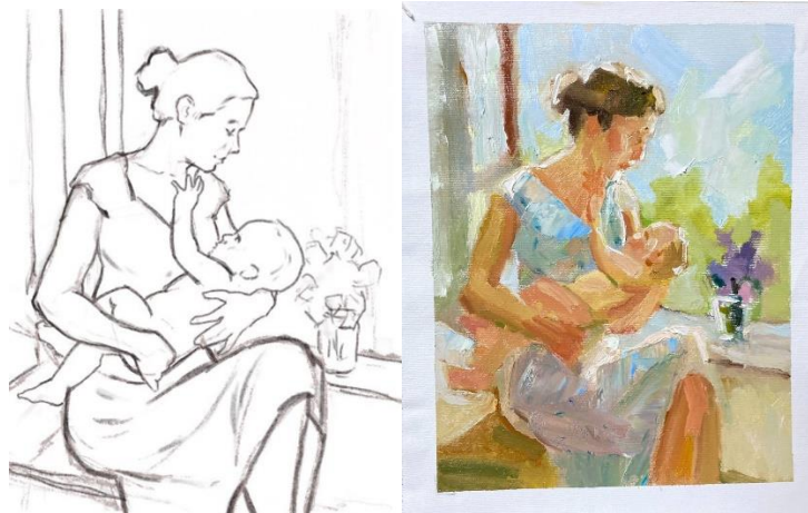
Рис. 9. Нариси до дипломної роботи

Висновки. Хоча тема материнства і є однією з найпоширеніших в образотворчому мистецтві, потенціал вивчення цього аспекту невичерпаний, адже материнство – це основа життя, символ відродження і надії. Дослідження відображає важливість та значення образу через призму мистецтва. Було розглянуто різні аспекти цієї теми, починаючи з історичного огляду образу в мистецтві різних епох, впливу релігії, культури та соціальних змін на уявлення про материнство. У статті було детально розглянуто роль ікон і образу Богоматері у формуванні образу материнства в мистецтві, зокрема їх символічне значення та вплив на мистецтво та культуру. Зазначено, що однією із провідних епох, що відіграла важливу роль у зображенні даної теми в мистецтві, стала доба Відродження, завдяки своїм гуманістичним цінностям та новим підходом до зображення людей. Особливо підкреслена важливість творчої діяльності жінок-художниць, що, крізь призму власного досвіду, вплинули на інтерпретацію материнства в мистецтві.