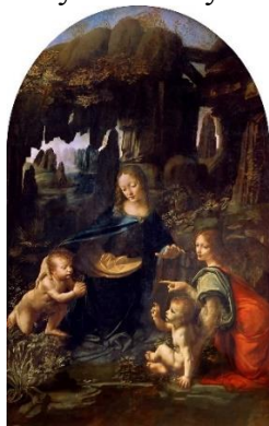
Рис. 3. Леонардо да Вінчі. «Мадонна в гроті», бл. 1483-1486 рр.

«Сікстинська Мадонна» (рис. 5) Рафаеля по праву вважається сакральним шедевром та грає величезну роль в зображенні материнства. Рафаель представив нову Мадонну – горду і скорботну: вона спускається назустріч людям прямо з небес, дивлячись глядачеві в очі.