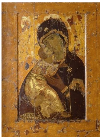
Рис. 2. Невідомий автор. Вишгородська ікона Божої Матері, XII ст.

Не менш важливим періодом в історії розвитку зображення материнства в мистецтві є епоха Відродження. Ця епоха визначалася великим підйомом в гуманітарних науках, розквітом культури та мистецтва, а також новим підходом до зображення людського життя [1]. В цей період образ материнства набув особливої важливості і став предметом глибокого вивчення та творчості для багатьох митців. Образ Матері в картинах епохи Відродження зазвичай зображувався як жінки з благородними та прекрасними обличчями, з виразом ніжності та відданості. Материнство в епоху Відродження символізувало кохання, турботу та безпеку.