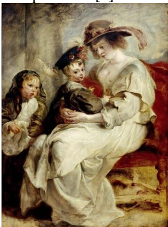
Рис.6. Пітер Пауль Рубенс. «Портрет Олени Фоурмен із дітьми», 1636 р.

Пізніше, справжнім майстром даного сюжету стає французький митець Вільям-Адольф Бугро. Одна з найвідоміших картин автора, «Щастя материнства» (рис. 7), присвячена саме цьому. На цій картині зображена жінка, що тримає маленьке дитя на руках, поглядаючи на нього з ніжністю та любов'ю. Емоційне зображення материнства в цій картині вражає своєю теплотою та гармонією [6].