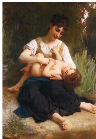
Рис.7. Вільям-Адольф Бугро. «Щастя материнства», 1878 р.

Переломним моментом в еволюції зображення материнства стає кінець XIX – початок XX століття. Соціокультурні зміни, індустріальний розвиток, загальна лібералізація суспільства, а також активний рух за права жінок відкриває художній простір для жінок. З'явившись на творчій арені, жінки художниці були готові зобразити сюжет материнства скрізь призму власного досвіду.