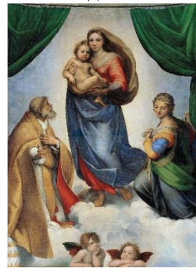
Рис.5. Рафаель Санті. «Сікстинська Мадонна», 1512-1513 рр.