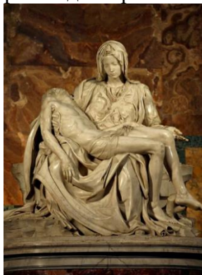
Рис.4. Мікеланджело Буанаротті. «П'єта», 1498-1499 рр.