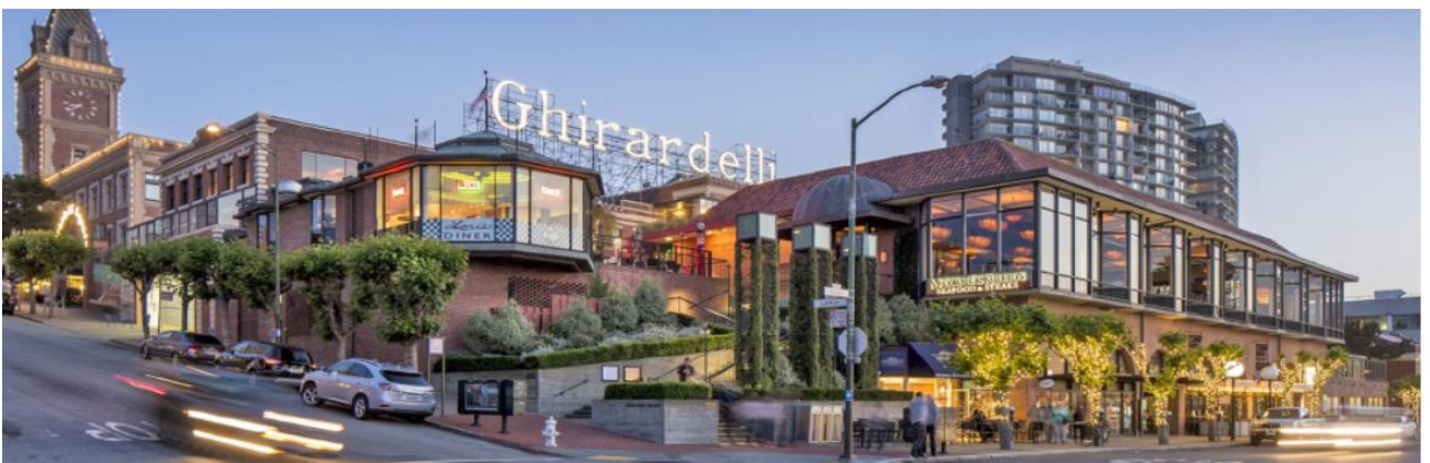
Рис. 3. Ghirardelli Square, Сан-Франциско. США