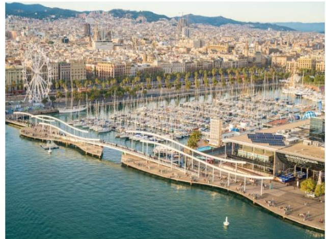
Рис. 2. Порт Велл , Барселона, Испания