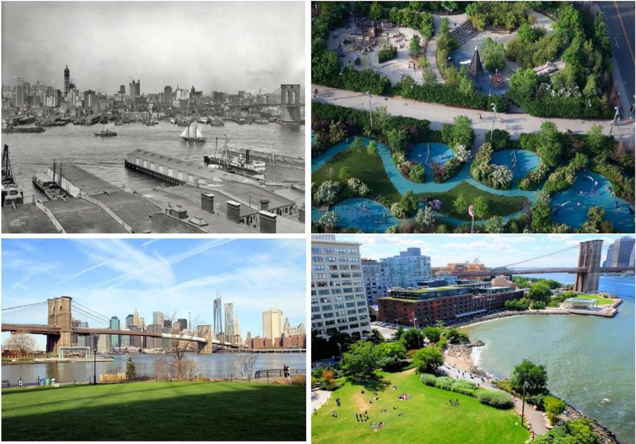
Рис. 1. Парк Бруклін-Брідж, Нью-Йорк

У 1985р. створена портом робоча група ініціювала створення спеціального органу управління, необхідного для просування та реалізації ідей щодо реновації портової території. Остаточне узгодження та затвердження перепланування урядом Каталонії було завершено до середини 1989 року. В результаті інтенсивних робіт до Літніх Олімпійських ігор 1992 року старі портові території були реконструйовані у прогулянкову-пляжну (рекреаційну) зону. Центр і північна частина міста були звільнені від вантажних терміналів. Адміністрація порту відкрила в центральній частині міста доступ до води для всіх мешканців та туристів, створивши простір, повністю вписаний у міське середовище, де традиційні елементи зливаються з сучасністю. Зараз це одне з унікальних та улюблених місць Барселони. На протязі багатьох століть порт Барселони відігравав активну роль у формуванні майбутнього міста, змінюючись і перетворюючись для комфортного проживання людей та економічного процвітання.