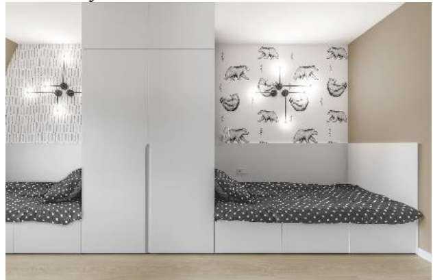
Рис. 3. Інтер'єр спальні та дитячої кімнати