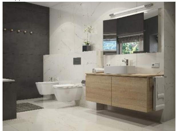
Рис. 4. Інтер'єр ванної кімнати