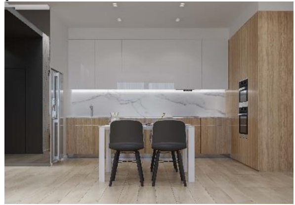
Рис. 2. Оздоблення кухні