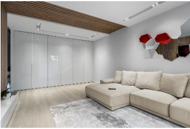
Рис. 1. Інтер'єр вітальні