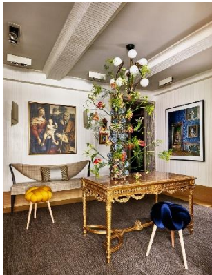
Рис. 2. Ванна кімната в проекті Jessica Lagrange Interiors