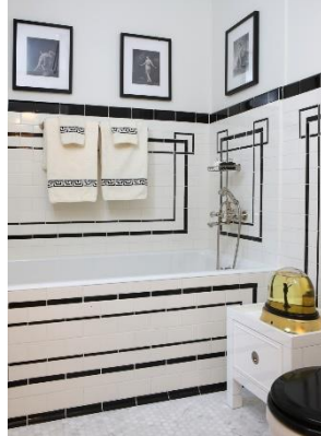
Рис. 3. Картата підлога в коридорі в проекті Jessica Lagrange Interiors