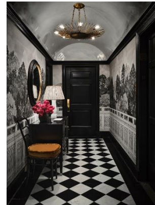
Рис. 4. Коштовні відтінки та позолота на виставці в домі Муна

Якщо повернутися до традиційного ар-деко 20-х років, то тоді використовувалось багато дуже насичених колірних палітр коштовних відтінків. Часто це доповнювалося більш нейтральними відтінками, такими як бежевий, кремовий або злегка приглушений жовтий. Сучасні інтерпретації декору можуть бути трохи мінімалістичнішими, але часто містять сміливі кольори [1] (рис. 5).