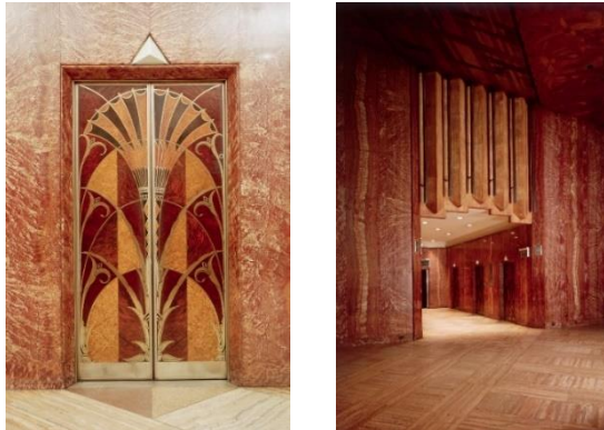
Рис. 1. Двері ліфту всередині та вестибюль Крайслер-Білдінг