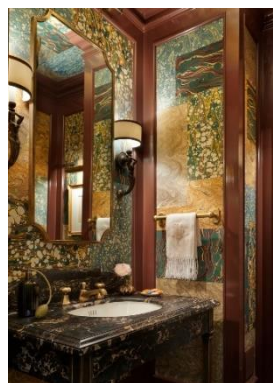
Рис. 5. Ванна кімната та зона відпочинку, Jessica Lagrange Interiors