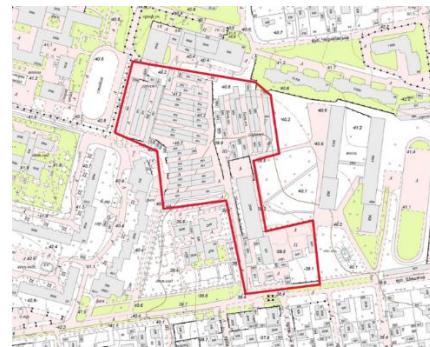
Рис. 5. Опорний план М 1:2000, Червоним кольором виділено територію медіатеки, основного підземного паркування та автобусного депо

Благоустрій та озеленення. Район має достатньо простору для озеленення але не має чіткої системи та знаходиться в розбитому стані. Також мікрорайон має діючий ботанічний сад, що додає унікальності ділянці (рис. 6).