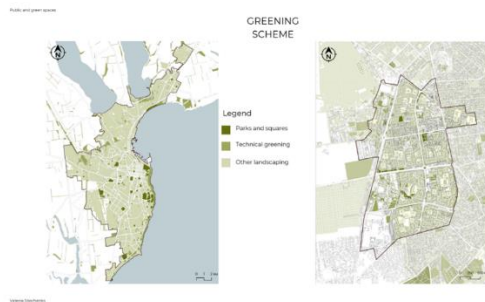
Рис. 6. Схема озеленення на рівні міста та району Таїрово

автобусних комплексів та велодоріжок, допоможуть підвищити якість життя мешканців району.