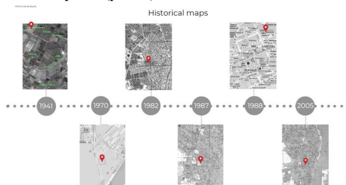
Рис. 1. Історичні мапи розвитку Вузівського

Щоб реалізувати ці плани шляхом будівництва прямих проспектів і великих кварталів, необхідно було масово знести вже існуючий приватний сектор, побудований поселенцями всього 5-10 років тому своїми руками. Тепер їм запропонували квартири у панельних багатоповерхівках. Це викликало хвилювання, листи до Києва та навіть протести біля дверей райдержадміністрації. В результаті влада вирішила пощадити найбільший шматок приватного сектору – село Моряків (рис. 1).