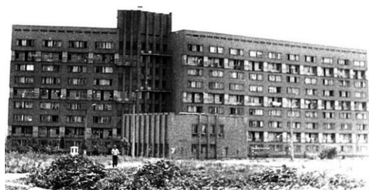
Рис. 2. Гуртожиток Одеського національного економічного університету, 1978 р.

У другій половині 1970-х рр. на місці сільськогосподарського поля між селами Дмитріївка та Дерibasівка було вирішено влаштувати мікрорайон студентських гуртожитків (рис. 2). Однак, перший навчальний заклад у цій місцевості з'явився ще у 1972 р. – технікум газової та нафтової промисловості Мінгазпрому СРСР (рис. 3) [2]. До початку 1980-х років на півночі майбутнього мікрорайону було споруджено лише один дворівневий гуртожиток Інституту народного господарства, ПТУ №5 кравців та шевців та два житлових будинки, після чого будівництво загальмувалося у наслідок того, що більша частина території так і не була надана під забудову. Всі споруди були виконані з цегли за типовими проектами.