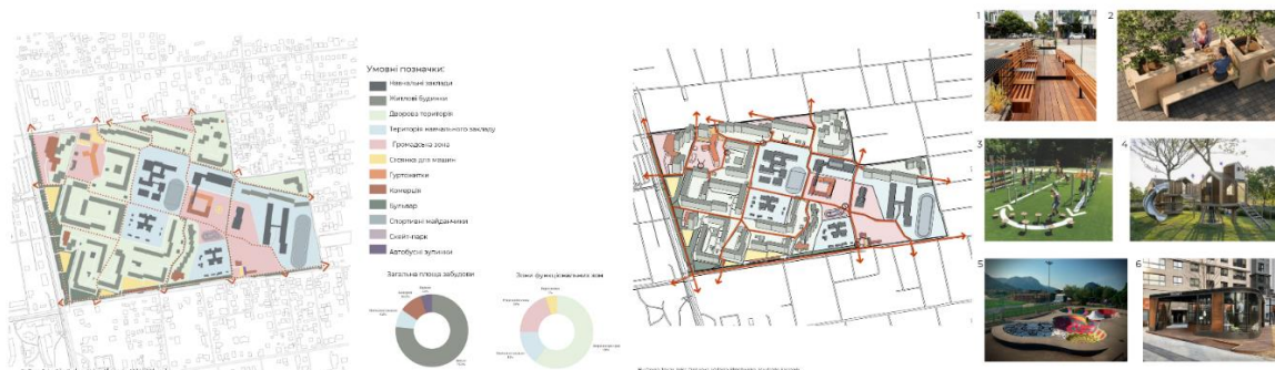
Рис. 8. Концепція розвитку мікрорайону Вузівський

Висновки. Реконструкція житлових будинків в мікрорайоні «Вузівський» є важливою для покращення якості житла та забезпечення комфорту мешканців. Цей процес дозволяє продовжити життєвий цикл будівель, забезпечити сучасне інженерне обладнання та підвищити енергоефективність. Комплексна реконструкція включає переосмислення суспільних цілей, збереження історичної цілісності та реконструкцію житлових та громадських будівель. Вона спрямована на створення високоякісного житлового середовища та забезпечення містобудівної ефективності.