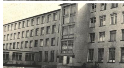
Рис. 3. Побудова нафтогазового технікуму

Лише у 1986 р. місту виділили останню частину ділянки площею 30 га під будівництво мікрорайону, але концепція його забудови до того часу кардинально змінилася. Внаслідок хронічної нестачі житлової площі було вирішено створити черговий житловий мікрорайон. Він був розрахований на 2976 квартир, планувалося спорудити дві школи, два дитячих садка, універсам, магазин продуктових товарів, відділ зв'язку, кафе. Таким чином на відміну від інших мікрорайонів на «Вузівському» була передбачена добре розвинена інфраструктура.