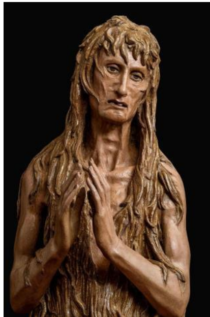
Рис. 5. «Magdalene Penitent» Донателло, 1453-1455 рр.

В епоху Відродження скульптура набуває нового імпульсу. Майстри стали більше звертати увагу на анатомічну точність та вираження людських емоцій. Роботи Берніні та Канови стали символами цього часу, розкриваючи глибину людської душі [2].