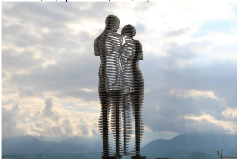
Рис. 6. «Алі і Ніно», Тамара Квесітадзе

У XIX столітті скульптура стала свідченням політичних та соціальних змін. Вона служила для висловлювання настрою і протесту. Прикладом таких робіт є «Партизанка» Липчиць або «Родена, що піднімається з могили» [2]. З початком XX століття скульптори починають експериментувати з новими матеріалами та формами. Кубізм, футуризм та абстракціонізм відкрили нові можливості для вираження ідей, створюючи незвичайні композиції з геометричних форм та ліній [2]. Сьогодні скульптура продовжує розвиватися у всіх її проявах – класичній, модерністській, концептуальній.