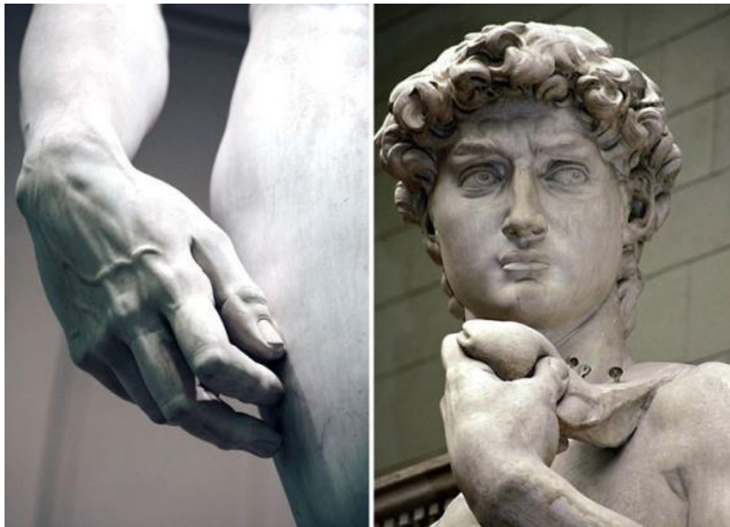
Рис. 2. Давид, Мікеланджело Буонарроті