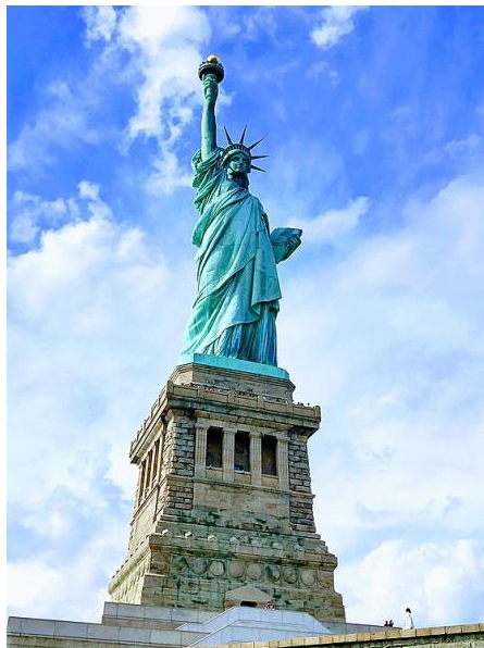
Рис. 3. Статуя Свободи, Фредерік Бартольці

Скульптура також сприяє збереженню культурної спадщини. Багато архітектурних споруд включають скульптурні елементи, які передають неповторний характер певної доби чи культури. Наприклад, середньовічні готичні собори прикрашені витонченими постатями ангелів та святих, які відбивають релігійні ідеали того часу.