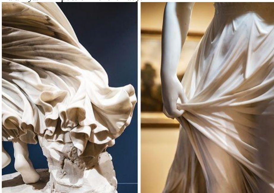
Рис.1. Томас Риджеуэй Гулд – «Західний вітер», 1870 р.

В своїх творіннях скульптори найчастіше відтворювали людей, тварин, рослини та інші предмети. Відповідно основними жанрами скульптури є портрет, історичні, побутові, символічні, алегоричні зображення та анімалістичний жанр. Окрім своєї естетичної привабливості скульптура має велику історичну цінність. Роботи видатних скульпторів високо цінуються і надійно зберігаються не тільки для того, щоб розкрити нам майстерність свого творця, але й щоб ми могли відчуті особливості життя людей у період створення цієї скульптури. Адже митці дуже часто вкладали в свої творіння глибокий сенс, відображаючи в них важливі та актуальні проблеми свого часу.