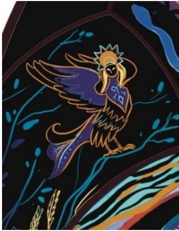
Рис. 4. Алконост