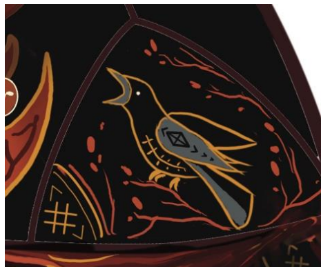
Рис. 8. Ворон