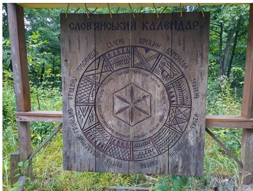
Рис. 2. Слов'янський календар

Верхня частина панно зображає вирій , в центрі зображено богиню Ладу – одну з головних богів слов'янського пантеону, богиню гармонії, порядку, плодючості та добробуту, що також часто виступала посередницею між живими та загибленими [2]. Позаду богині зображено Дерево Життя , поміж гілок якого спочивають праведні душі та птахи (рис. 3). Обабіч центрального фрагменту верхньої частини представлені міфічний птах Алконост – житель вирію , провісник щастя (рис. 4); та зозуля із золотим ключем від воріт вирію (рис. 5).