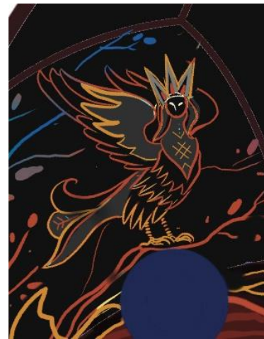
Рис. 7. Сірін