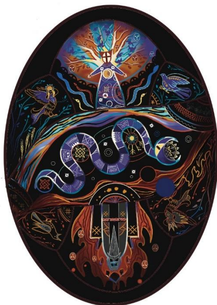
Рис. 9. Ескіз керамічного панно «Шляхи небесні», автор Еліна Жукова

Загальний сюжет панно являє собою відображення культурної спадщини давніх слов'ян, зображаючи при цьому як широко, так і маловідомі художні образи слов'янської міфології, що стимулює обговорення, порівняльний аналіз художніх образів та сюжетів з паралелями в інших культурах світу і таким чином не тільки популяризує обрану тему, а й доводить ефективність мистецтва, як інструменту популяризації (рис. 9).