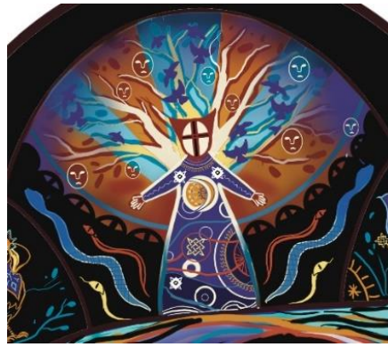
Рис. 3. Центральний фрагмент верхньої частини панно «Шляхи небесні», автор Еліна Жукова