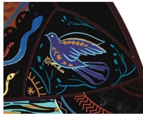
Рис. 5. Зозуля