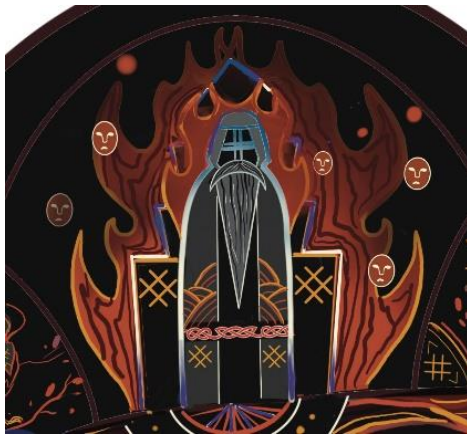
Рис. 6. Ний, володар пекла, фрагмент панно