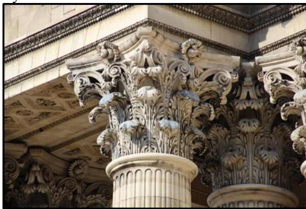
Рис. 1. Приклад капітелі з Пантеону

Основною проблемою інтеграції ордера, у колишньому розумінні цього слова, а саме чогось дуже великого, що може витримати на собі колосальні маси каменю, є тектоніка. У класичному розумінні вона відображає відчуття ґрунтовності конструкції будівлі, або скоріше її образу у сприйнятті глядача, осмислення тяжкості архітектурної форми та, одночасно, стійкості [2]. Колона, як головний несучий елемент ордера, підтримує масу антаблемента, і в уявленні людини цей важливий елемент не може бути чимось непомітним. Однак, що ми бачимо у сучасній архітектурі? Чи можемо ми згадати якийсь приклад з новітньої архітектури з колонами, велич яких могла б порівнятися з величиною наприклад колон римського Пантеону?