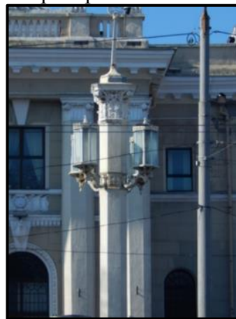
Рис. 4. Модифікований ліхтарний стовп

Недалеко від будівлі залізничної станції ми можемо побачити більш модерністичне застосування ордера в будівлі клубу «Palladium». Ці колони, що прикрашають два входи до