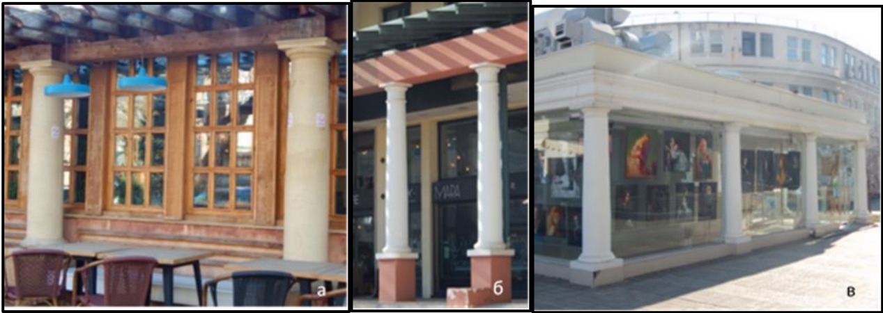
Рис. 7. а – вул. Єврейська кут вул. Катериненської; б – вул. Дерибасівська, 27; в – вул. Грецька площа, 2

колон, які служать для підтримки карнизів, або імітації антаблемента, в суто декоративних цілях.