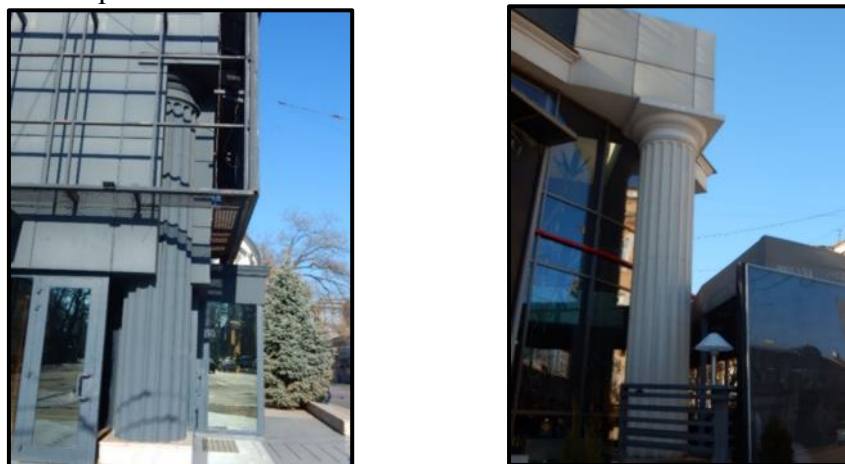
Рис. 5. Клуб «Palladium», вул. Італійський бульвар 4

будівлі – приклад використання образів доричного ордера у сучасній архітектурі. Колони зберегли свої канілюри, проте їх розміри та пропорції порушені. Одна з колон має стандартний гіпсовий колір, більш тонка і більше схожа на звичайний ордер, тоді як друга захована під обшивкою із металу, і майже не виділяється на тлі чорних блоків, оскільки також має чорний колір.