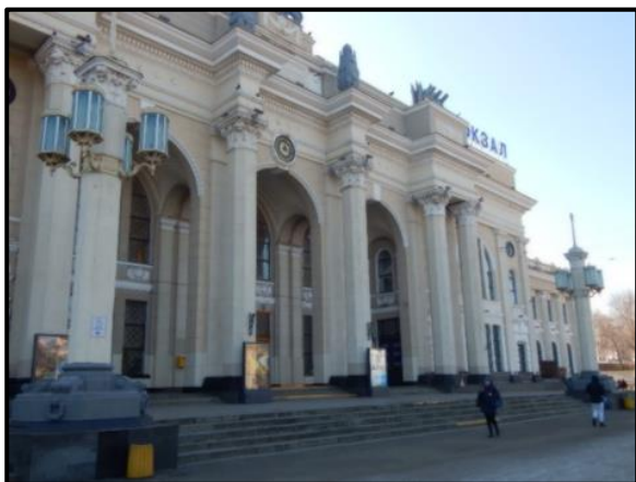
Рис. 3. Центральний вхід на залізничну станцію

Ще одним чудовим прикладом можуть бути колони залізничного вокзалу, але як ми бачимо в цьому випадку вони втратили циліндричну форму стовбура і для архітектурного задуму автора вони набули нової форми восьмикутного паралелепіпеда. І так само біля вокзалу ми можемо побачити приклад використання несучої частини ордерної системи – колони, в іншому ключі. Територія біля центрального входу прикрашена ліхтарними стовпами у вигляді колон з тією ж формою стовбура, як біля будівлі. Це є яскравим прикладом переходу функцій ордерної системи в більш декоративну галузь та її диференціації в дизайні не тільки будівлі, а безпосередньо й території навколо.