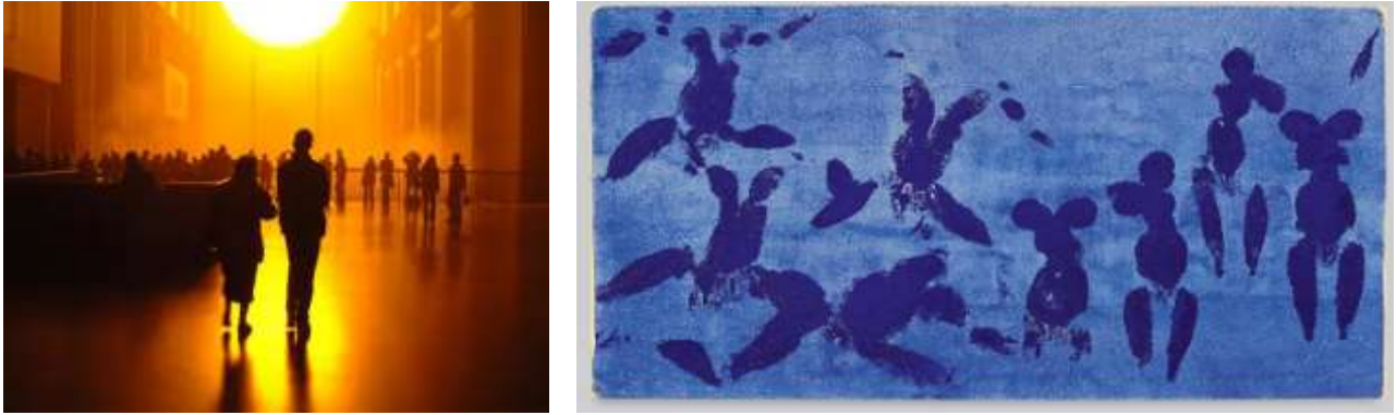
Рис.1. Зліва: Олафур Еліассон. Виставка «У реальному житті», Tate Modern. Сонце (зроблено із сотень лампочок), туман (штучний), серпанок. 2003 рік. Зправа: Ів Кляйн (1928-1962), «Антропометрія блакитного періоду», (ANT 124). Ціна - £ 27 197 000, Christie's

в світі і зараз, і в найближчому майбутньому залишилася тільки реальність як стіна, як купа цегли, яку нам і показують, кажучи: ось це мистецтво. Як вибудувувати світ за відсутності ідеалу? Я не пророк, але мені ясно: те, що зараз показують на наших бієнале, це піде. Тому що консервовані акули та вівці – це не художня форма. Це жест, висловлювання, але не мистецтво» - з лекції І. А. Антонової (1922-2020 р. н.), мистецтвознавця, фахівця з італійського живопису епохи Відродження.