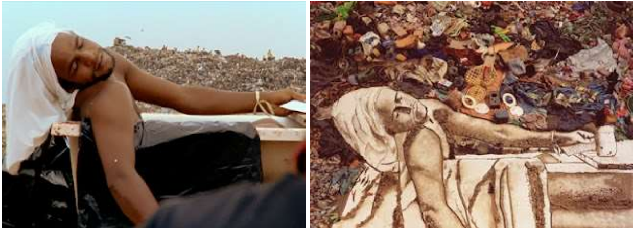
Рис.3 «Відійдіть, я зображатиму мертвого!..» Вік Муніс, художник сучасного мистецтва та його збирачі сміття. Залучав до проблеми сміттевого колапсу. Фото інсталяції і майбутня картина. Фото куплено за 32 000 фунтів стерлінгів.

Як навчити на прикладах сучасного мистецтва? Нас як викладачів хвилює передача досвіду та знань студентам для підготовки грамотних фахівців, які впевнено працюють у різних напрямках творчого життя, виконують замовлення різної складності. А для цього потрібні знання академічної школи, з її правилами та законами. Історія довела, експериментувати, креативити, шукати нове можливо, лише досягнув віртуозного володіння навичками малюнку, живопису, композиції.