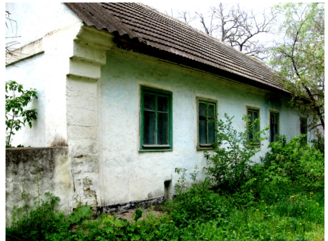
Рис.8. Брошенный жилой дом.