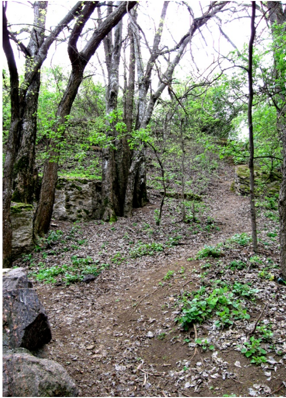
Рис.5. Вид лиственного леса, заложеного в XIX ст. близ с. Севериновка.