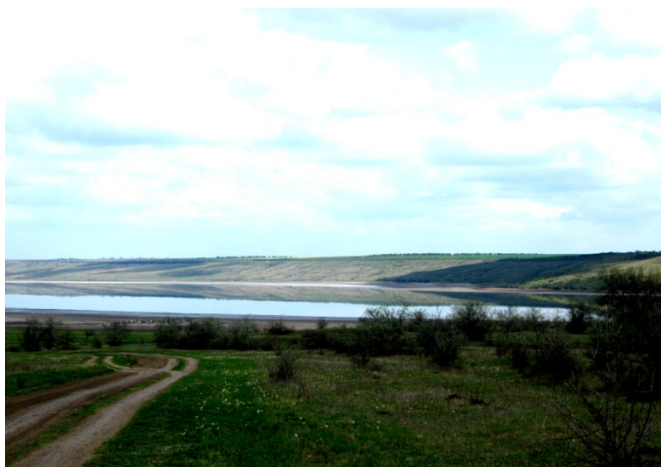
Рис.3. Общий вид на Куяльницкий лиман. грязевых