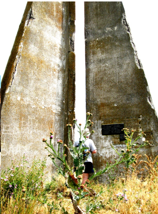
Рис.2. Обелиск на месте гибели Лейтенанта Шмидта.