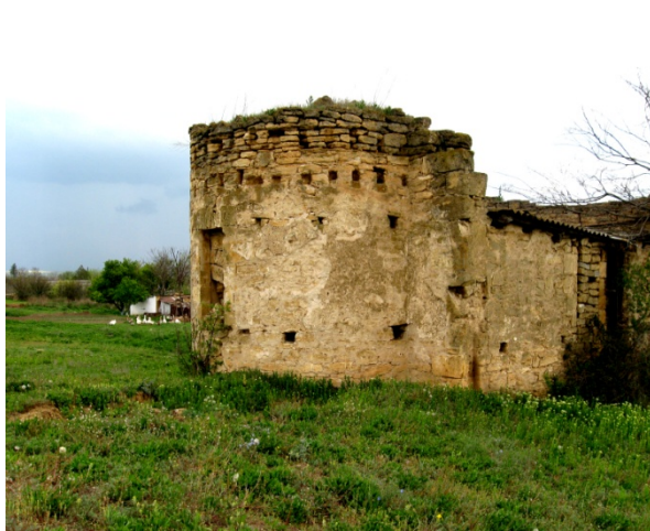
Рис.7. Руины костела. дом.