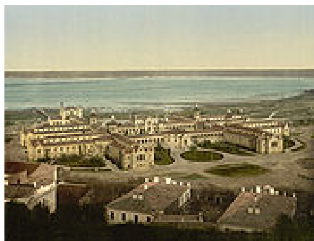
Рис.4. Один из старейших курортов Украины, основан в 1834 г. в низовьях лимана.