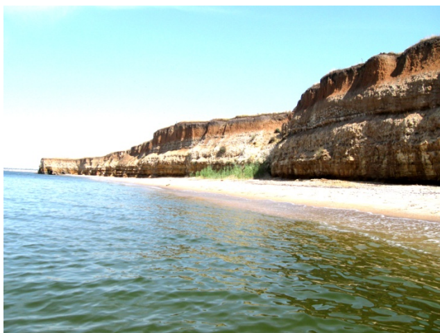
Рис.1. Общий вид на побережье острова Березань.

критическом состоянии таких исторически ценных объектах как усадьбы в с. Петровка, с. Васильевка, где тесно переплетены проблемы экологии ландшафта и спада хозяйственного развития, решаемые лишь комплексно.