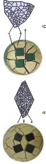
Рис.2. Влияние ориентирования заполнителей на организацию микроstructures бетона: