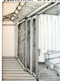
Рис. 4 Раздвижные перегородки