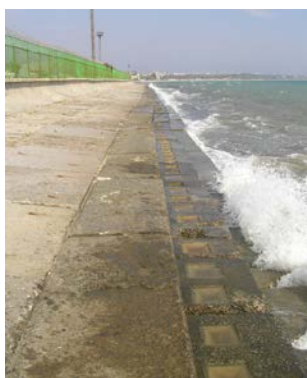
Рис.2. Смещение элементов берегозащитного сооружения от проектного положения

В процессе обследования технического состояния одного из берегозащитных сооружений полуоткосного типа в Одессе были выявлены смещения отдельных конструктивных элементов (упорных и ступенчатых массивов) от проектного положения и их локальные разрушения (см. рис.2).