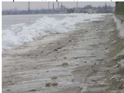
Рис.1. Воздействие ледовых образований на берегозащитное сооружение

В процессе проектирования берегозащитных сооружений пассивного типа необходимо учитывать множество факторов, характеризующих естественные условия района строительства. К ним, прежде всего, относятся инженерно-геологические, гидрологические, океанологические, метеорологические условия, а также наличие местных строительных материалов, инфраструктуры района строительства, технических возможностей потенциальных подрядчиков и других факторов. Опыт проектирования, строительства и эксплуатации берегозащитных сооружений в Украине, и в Одесском регионе в частности, показывает, что при проектировании уже построенных сооружений не учитывались ледовые режимы рек, водохранилищ, а также Черного и Азовского морей в суровые зимы редкой повторяемости. Как показывает анализ результатов многолетних наблюдений, в 18 из 26 зим лед отсутствовал либо появлялся в начальных формах (сало, забереги, блинчатый лед). Тем не менее, в суровые зимы толщина ледяного покрова на всех акваториях может достигать до 0,7м при продолжительности периода времени с отрицательными температурами до 30 и более суток. Такие зимы в среднем повторяются один раз в десять лет (см. рис.1).