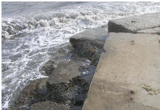
Рис.3. Локальное разрушение железобетонного ступенчатого массива

В надводной части сооружения было зафиксировано практически полное разрушение железобетонного ступенчатого массива (см. рис.3).