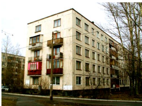
Рис. 2. Всім відомі функціональні, але не корисні на всіх рівнях «Хрущовки» 1960-х років

Неврахування необхідності проектування відразу на трьох зазначених рівнях (як і пошуку користі відразу на трьох рівнях буття) постійно призводить до періодичного домінування в житті і в архітектурі перекосів то в бік надмірного естетизму (наприклад, стиль «бароко»), то в бік функціоналізму, нехтуючи потребами естетики чи комфорту (романський період чи функціоналізм (рис. 2), то в бік інших крайнощів (рис. 3).