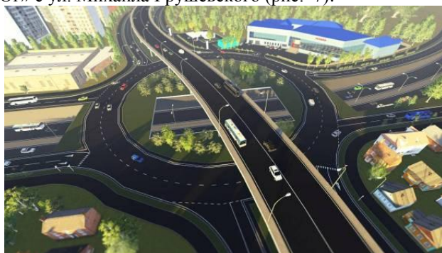
Рис. 7. Трехуровневая транспортная развязка на магистрали

Наиболее ярко использование данной функции демонстрирует проект трехуровневой транспортной развязки на пересечении магистрали «Север - Юг» с ул. Михаила Грушевского (рис. 7).