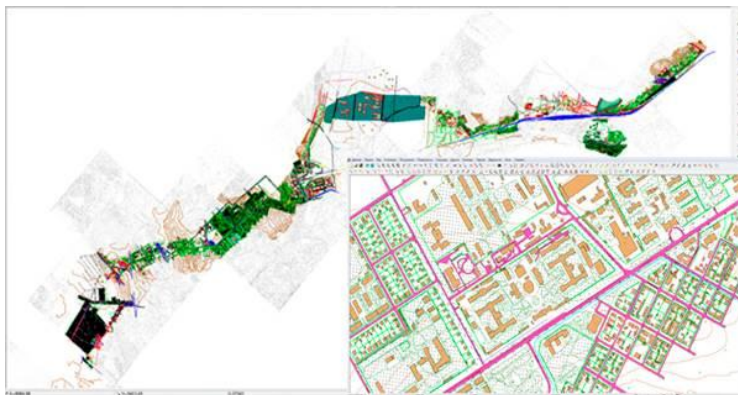
Рис. 3. Созданная цифровая модель местности