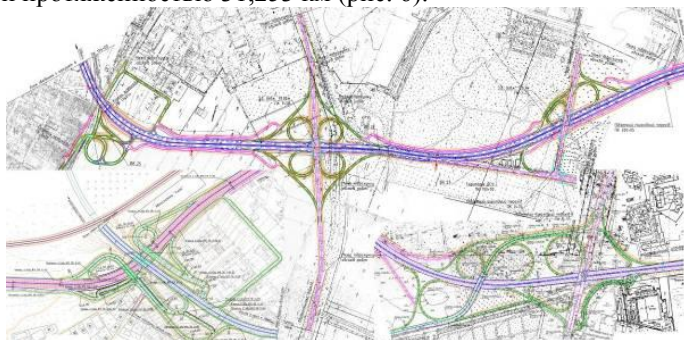
Рис. 6. Транспортные развязки на магистрали

нужный съезд. Таким образом было запроектировано 114 съездов общей протяженностью 31,253 км (рис. 6).