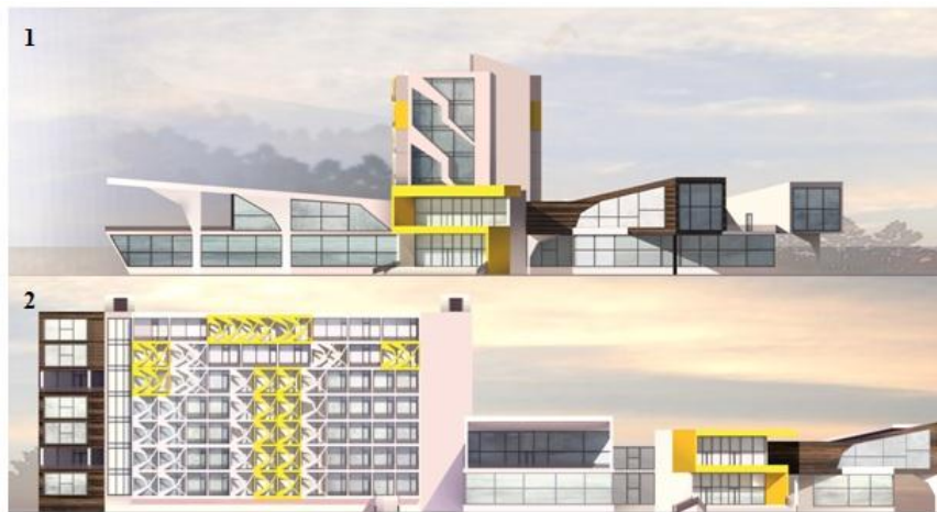
Рис.5. Экстерьер бизнес-гостиницы: 1 – фасад в осях 1–15; 2 – фасад в осях Ц–А

Жилая зона состоит из административной группы помещений (расположена на первом этаже здания) и жилых номеров с поэтажным обслуживанием. Жилые номера рассредоточены по этажам в зависимости от уровня комфортности. На плане на отметке +13,400 размещаются: комната дежурного персонала, номер 1 категории на 1 место, полулюкс студия, бельевая, открытая терраса, бар на 20 мест, подсобное помещение бара. На плане на отметке +17,700 размещаются: полу-люкс, бельевая, открытая терраса, холл, дуплекс люкс, кладовая уборочного инвентаря. На плане на отметке +21,000 находятся: президентский апартамент, полу-люкс, бельевая, холл, дуплекс люкс, апартамент, комната дежурного персонала.