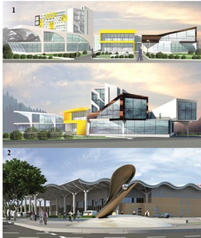
Рис. 4. Общий вид застройки: 1 – проектируемая бизнес-гостиница; 2 – новый терминал пассажирского аэропорта