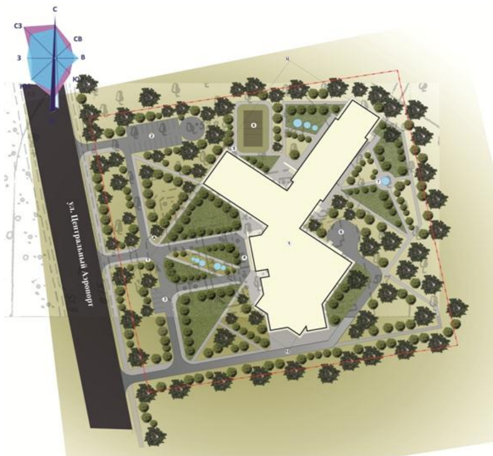
Рис. 3. Генеральный план проектируемого участка:

Второй этаж общественной зоны состоит из: вестибюльной группы, помещения общественного писания, культурно-зрелищного назначения и проведения досуга, бытового обслуживания и торговли и бизнес-центра.