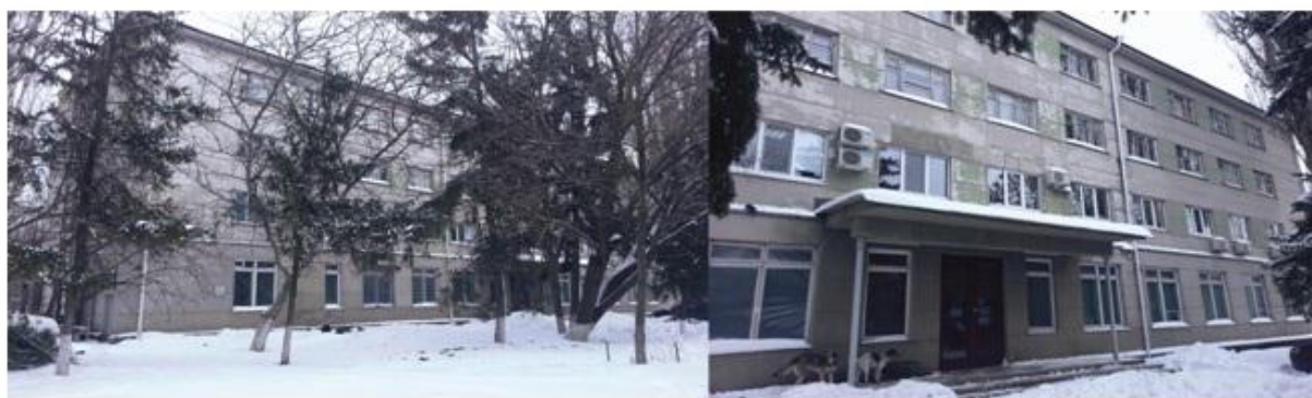
Рис. 2. Фотофиксация здания бывшей гостиницы

Здание, стоящее на проектируемом участке, не эксплуатируется и рекомендуется под снос. Внешний архитектурный облик здания не соответствует изменениям в застройке и не вписывается в окружающую среду данной территории (рис. 2). Здание бывшей гостиницы рассчитано на обслуживание 150 посетителей, без предоставления необходимых помещений досугового назначения и обслуживания, что требует изменения действующих нормативных документов. В связи с несоответствием требуемого строительного объема для комплексного обслуживания пассажиров и персонала аэропорта, здание не подлежит модернизации, что вызывает потребность в строительстве нового типа здания.