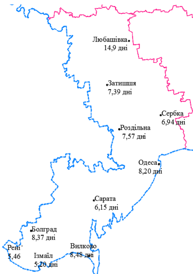
Рис. 1. Річна кількість спекотних днів на метеостанціях Одеської області