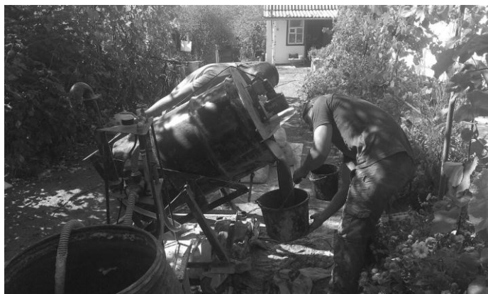
Рис. 2. Виготовлення монолітного пінобетону в умовах приватного домоволодіння

Стінові блоки власного виробництва ТОВ «БУДСПЕКТР» широко використовуються в котеджному та дачному будівництві в м. Кропивницький та в Кіровоградській області. Приклад виконання стін з пінобетонних блоків наведено на рисунку 3.