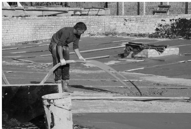
Рис. 5. Влаштування наливного пінобетонного даху в м. Знам'янка, Кіровоградської області

Виконаний у 2013 році в м. Знам'янці наливний дах промислової будівлі площею 540 м 2 протягом трьох років експлуатувався без гідроізоляції, але тріщин та протікань даху в процесі тимчасової експлуатації без гідроізоляційного шару не виявлено.