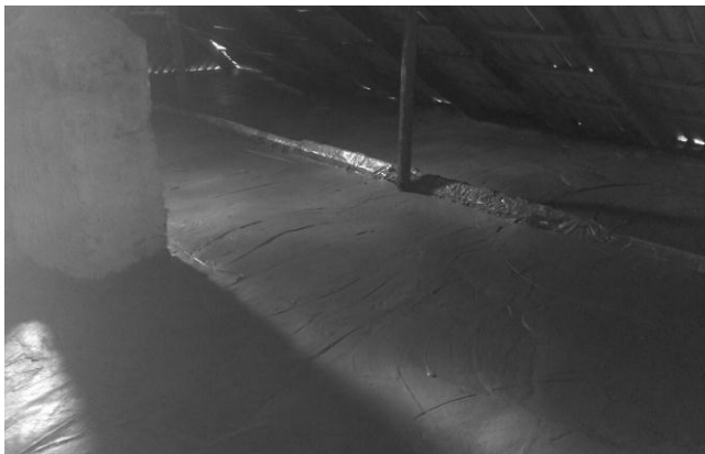
Рис. 4. Влаштування наливної пінобетонної теплоізоляції перекриття приватного будинку у с. Кам'яний Брід, Кіровоградської області

Окрім виготовлення стінових блоків, ТОВ «БУДСПЕКТР» має накопичений досвід влаштування монолітних конструкцій з пінобетону, зокрема наливної пінобетонної теплоізоляції при влаштуванні дахів і перекриттів житлових і промислових будівель. В якості прикладів на рисунку 4 зображена наливна пінобетонна теплоізоляція перекриття приватного будинку, а на рисунку 5 – процес влаштування наливного даху промислової будівлі з теплоізоляційного малоусадкового пінобетону.