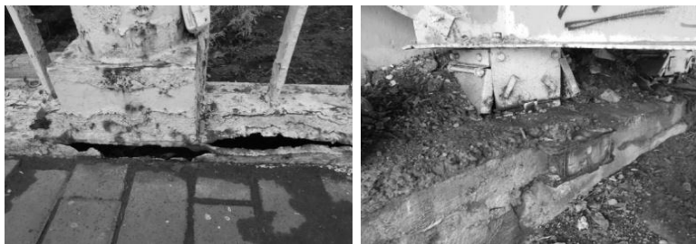
Рис. 5. Тещин мост. Коррозия металла перил, захламлённость опорной части

Мостовые сооружения на Пересыпи также требуют текущего ремонта. При детальном осмотре обнаружено выкрашивание бетона, коррозия металлических элементов моста, особенно опасным является наличие рыжих пятен снизу пролётного строения. Эти разрушения вы-