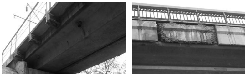
Рис.6. Дефекты путепроводов Пересыпи

званы коррозией арматуры главных балок и требуют вмешательства соответствующих служб