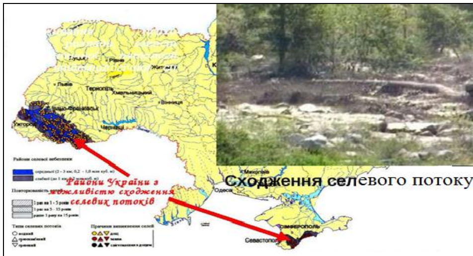
Рис.1. Области селевої небезпеки в Українських Карпатах і гірському Криму [13]

Селевий басейн може бути поділений на три основні зони: