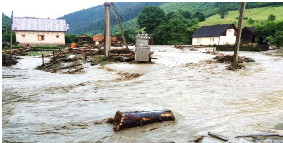
Рис. 3. Наслідки сходу селевих потоків

В селі Луги підтоплені 23 домогосподарства, в селі Богдан – 2, в селі Видричка – 8 домогосподарств. В результаті негоди були знеструмлені 4 населені пункти: с. Розтоки, с. Видричка, с. Богдан, с. Луга.