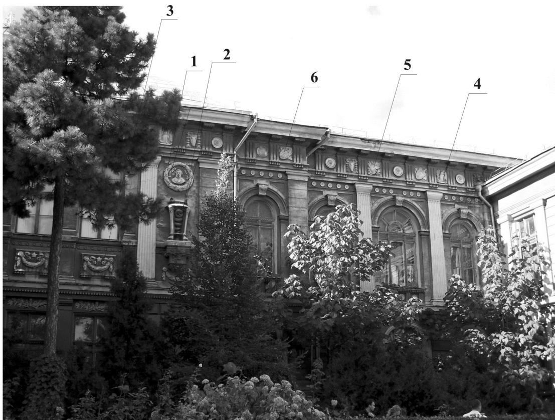
Рис. 2 Здание анатомического театра Одесского медицинского университета