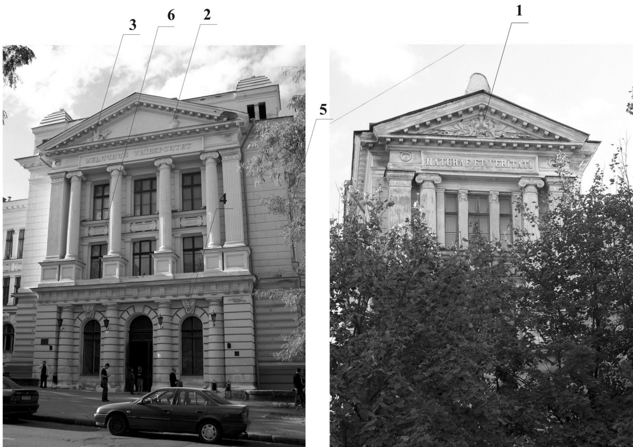
Рис. 1 Главный корпус Одесского медицинского университета