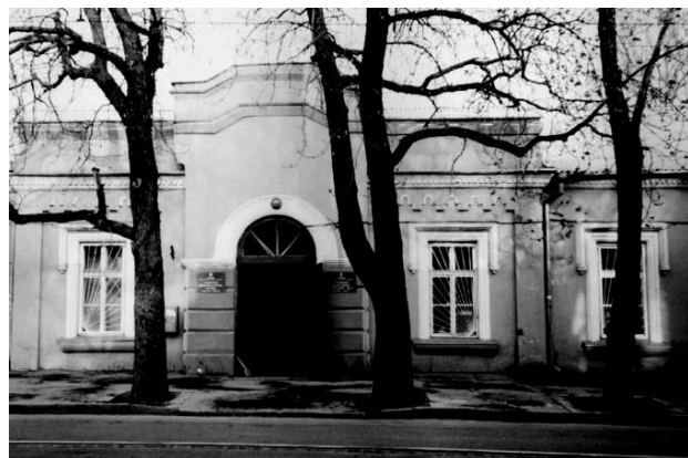
Рис. 8 Здание приюта призрения сирот им. П.Е. Коцебу (ул. Старопортофранковская, 8). Общий вид здания в нач. XX в. Общий вид здания в 2004 г.