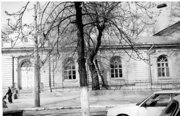
Рис. 5 Сиротский приют «Гладкова», 1879 г. (ул. Успенская, 2) Общий вид здания в 2004 г.