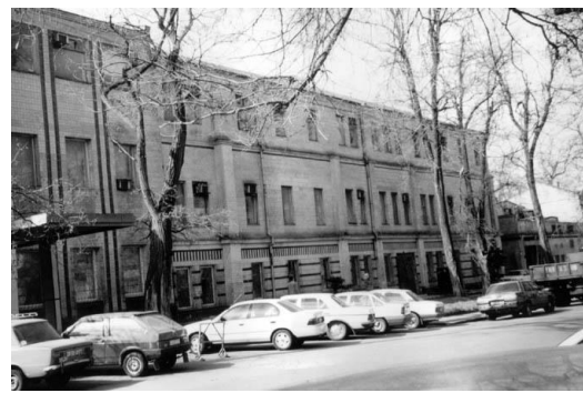
Рис. 4 Еврейский сиротский дом, 1868 г. (ул. Базарная, 5). Общий вид здания в конце XIX в. Общий вид здания в 2004 г.