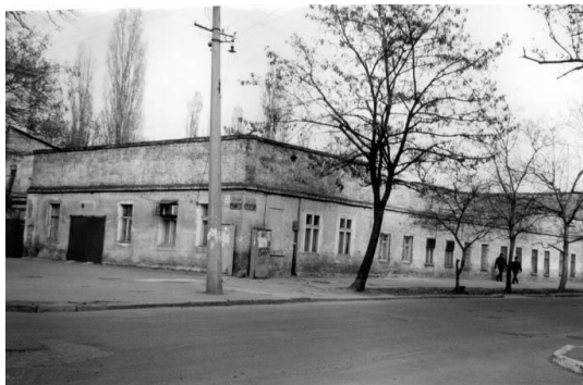
Рис. 3 Михайло – Семеновский сиротский дом, 1859 г. (Высокий переулок, 22). Общий вид здания в конце XIX в. Общий вид здания в 2004 г.