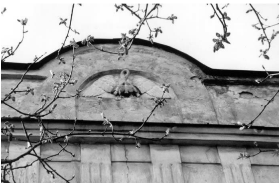
Рис. 1 Александровский приют, 1847 г. (ул. Разумовская, 3). Общий вид здания в 2004 г. Деталь фронтона.