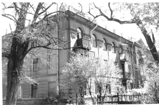
Рис. 2 Приют имени Государыни Императрицы Марии Федоровны, 1867 г. (ул. Мариинская, 1). Общий вид здания в конце XIX в., в 2004 г.