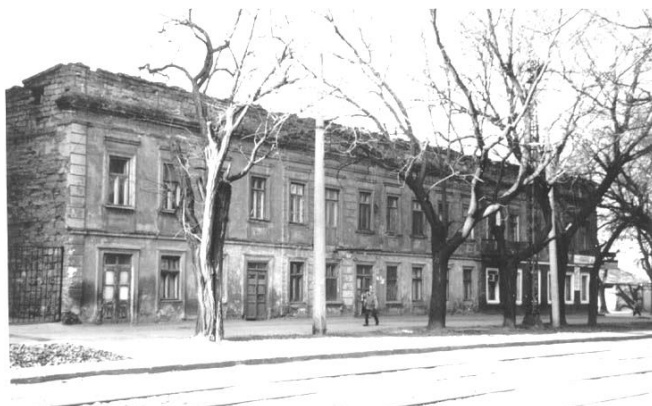
Рис.7 Убежище им. Наследника Цесаревича Алексея Николаевича (ул. Колонтаевская, 11) Общий вид здания в 2004 г.