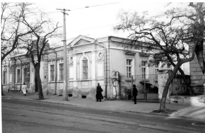
Рис. 6 Детский дневной приют имени «Константина и Елены», 1892 г. (ул. Старопортофранковская, 4) Общий вид здания в конце XIX в. Общий вид здания в 2004 г.