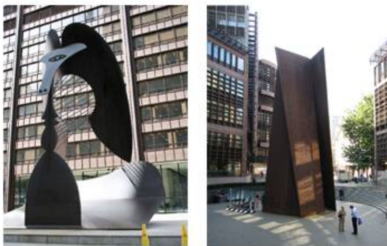
Рис.1 «Голова женщины» Пикассо, Чикаго. Рис.2 «Точка опоры» Ричард Серр, Лондон

Трудно точно определить, когда термин «public art» (публичное искусство) вытеснил термин «public sculpture» (скульптура в общественных местах), но уже с конца 60-х годов он начинает использоваться более или менее регулярно. В каталоге выставки «Sculpture in the Environment» («Скульптура в окружающей среде», Нью-Йорк, 1967) Ирвинг Сандлер пишет: «если достаточное количество художников получит возможность работать в публичных пространствах, может сформироваться новая эстетическая традиция, традиция современного искусства в общественных местах (public art), отличного от искусства мастерских (studio art)» [1].