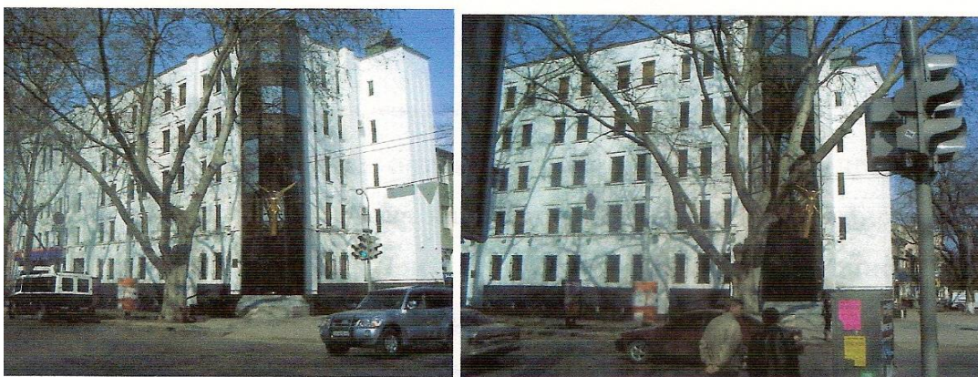
Рис. 3. Центр реабилитации детей-инвалидов «Будущее», г. Одесса.

Одесский Центр реабилитации детей-инвалидов «Будущее» (рис. 3) создан в 1996 году. Его вместимость 150 человек. Он является негосударственной, некоммерческой организацией, руководство которой осуществляет благотворительный фонд «Будущее». Комплексный подход к ребенку с ограниченными возможностями здоровья, который реализован в Центре, содействует решению наиболее актуальных задач медико-социальной реабилитации и улучшению качества жизни детей-инвалидов и детей с ограниченными возможностями здоровья. Все виды помощи в Центре предоставляются бесплатно. Здание построено для данного центра с учетом большинства санитарно-гигиенических требований, запрограммированной развитой функцией (консультации, лечение, обучение, социальная реабилитация), а также построены гостиница для проживания детей и родителей и учебный компьютерный центр.