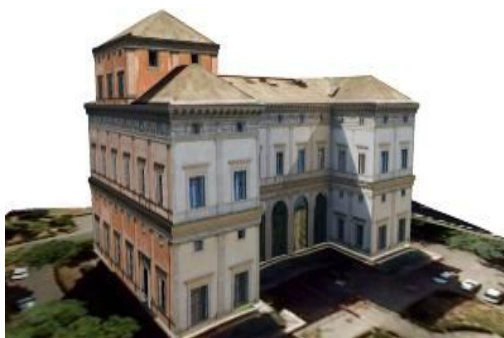
Рис. 1. Вилла Фарнезина. 1511 г.

Одним из часто встречающихся элементов объёмно-пространственной композиции одесских дач является башня. Башня, как композиционный элемент виллы, пришла из архитектуры итальянского Ренессанса. В архитектуру Ренессанса башня, в свою очередь, «перекочевала» из средневековья, где она выполняла оборонительную функцию, кроме того, башня должна была подчеркнуть знатность рода и высокое общественное положение владельца дома. Функцию символа феодальной власти и древнего происхождения рода башня сохранила и в виллах Нового времени. Башня появляется «в проектах некоторых вилл у А. Палладио – это вилла Серего, вилла Пизани, вилла Репета (в натуре во всех этих виллах башни осуществлены не были) и др.» [6, с. 3]. Не только Палладио включал в композицию виллы башню, это и Бальдассаре Перуцци (вилла Фарнезина) (рис. 1), и Виньола (вилла Капрарола), и Джорджо Вазари (вилла Боргезе) (рис. 2), и другие мастера Возрождения. В ренессансной вилле башня претерпевает трансформацию от средневековой башни-донжона до башни-павильона, часто называемого «бельведер», и угловых ризалитов, и в таком виде распространяется в архитектуре других европейских стран.