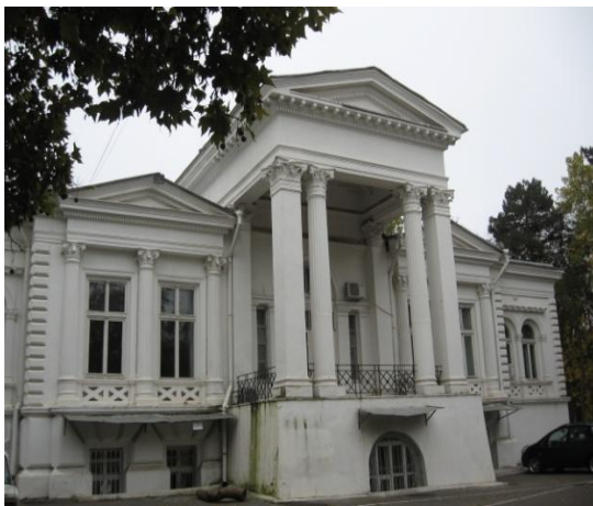
Рис. 11 Дача Ашкенази, 1901 г., арх. В. И. Прохаска.

Ещё одним мотивом, навеянным итальянской ренессансной и барочной архитектурой, получившим распространение в архитектуре одесских дач историзма, стал мотив глубокой лоджии на главном фасаде здания. В архитектуре итальянского Ренессанса лоджии открывались арками, в одесской архитектуре историзма лоджия могла открываться также и колоннадой (например, дача Мартыновой, дача Маврокордато). В центре такой итальянской лоджии предусматривался проход, соединяющий двор и сад [7]. Лоджии одесских дач, как правило, также имели сквозной проход (дача Переца, Французский бульвар, 22, дача Ашкенази, дача Параскева и др.). На перекрытии лоджии, подобно итальянским прототипам (вилла Боргезе), устраивалась глубокая терраса. «Такие приёмы хорошо отвечают загородному характеру дома, открытого в природу» [7, с. 419], и, кроме того, соответствуют климатическим условиям Одессы, что является ещё одной причиной, почему этот приём прочно утвердился в архитектуре дач.