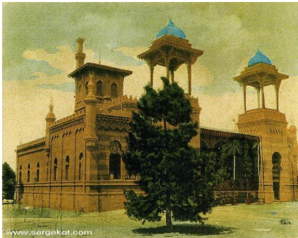
Рис. 9. Здание гидропатической лечебницы Одесской Санатории, 1890-е гг. Арх. ? Старинная открытка