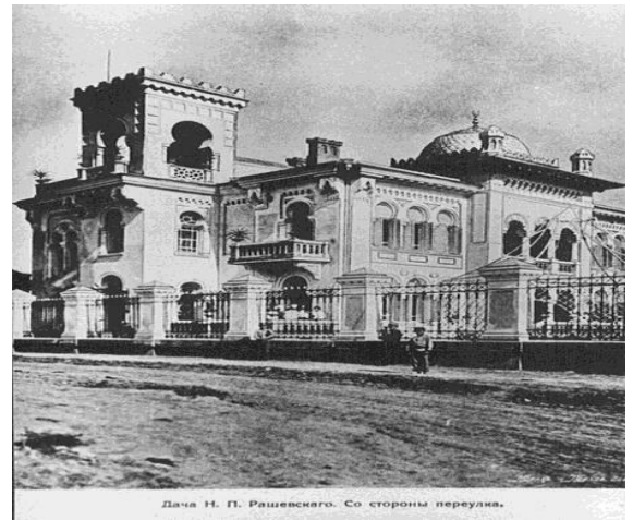
Рис. 10. Дача Макареско (дача Рашевского), 1890-е гг., арх. В. И. Шмидт. Фото [9]