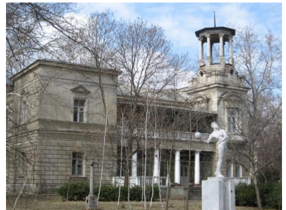
Рис. 6. Дача Маврокордато, конец XIX в., арх. Ю. М. Дмитренко.