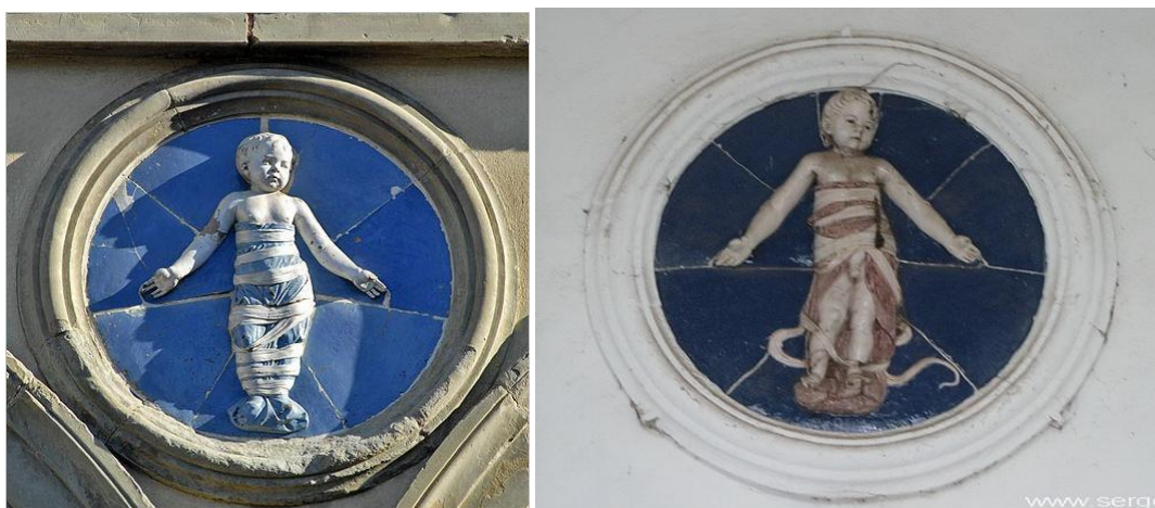
Рис. 12. Медальон аркады Воспитательного дома, арх. Брунеллески, (слева) и медальон на стене лоджии дачи Ашкенази (справа)

Композиция фасада со стороны моря носит «приглашающий» характер, что усиливается наличием лестницы и тремя пролётами широко открытых арок. Прототипом для решения этого фасада послужил мотив портика-лоджии, характерный для архитектуры итальянского Ренессанса. На стене лоджии находятся два майоликовых барельефа, изображающих младенцев, обвязанных лентой, – копия медальонов работы Андреа делла Роббиа, украшающих аркаду лоджии Оспедале дельи Инноченче во Флоренции.