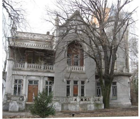
Рис. 8. Дача Анатра. 1913 г. арх. Ю. М. Дмитренко.