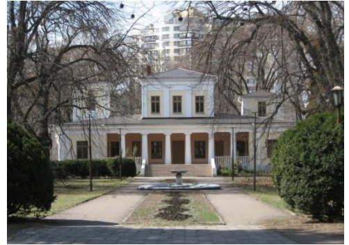
Рис. 3. Дача Мартыновой. Фото 1910-х гг. [9].