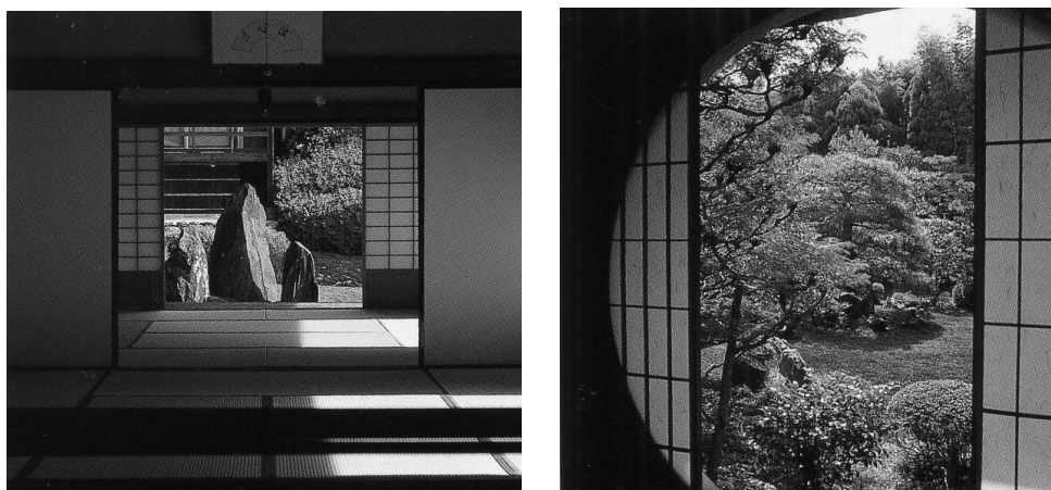
Рис. 5. Вид на японский сад из окна веранды

Из окна веранды маленький садик кажется огромным благодаря искусному использованию японскими садоводами перспективных соотношений (Рис. 5).