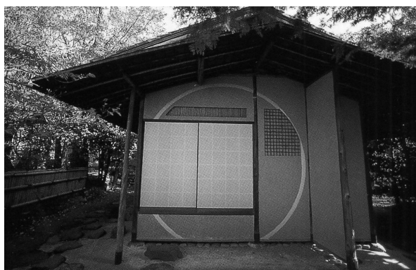
Рис.1. Чайный домик

В период династии Эдо (1615–1867) получили распространение небольшие садики, которыми можно было любоваться, не выходя из дома. Они моделировались как «чайные». К эпохе Мейдзи (1868–1912) и относится формирование облика современных японских садов. Чаепитие было неотъемлемой частью культовых обрядов джайнизма, и потому существенным дополнением садов стали чайные домики – непритязательные, крытые тростником постройки, убранные внутри соломенными циновками (Рис.1).