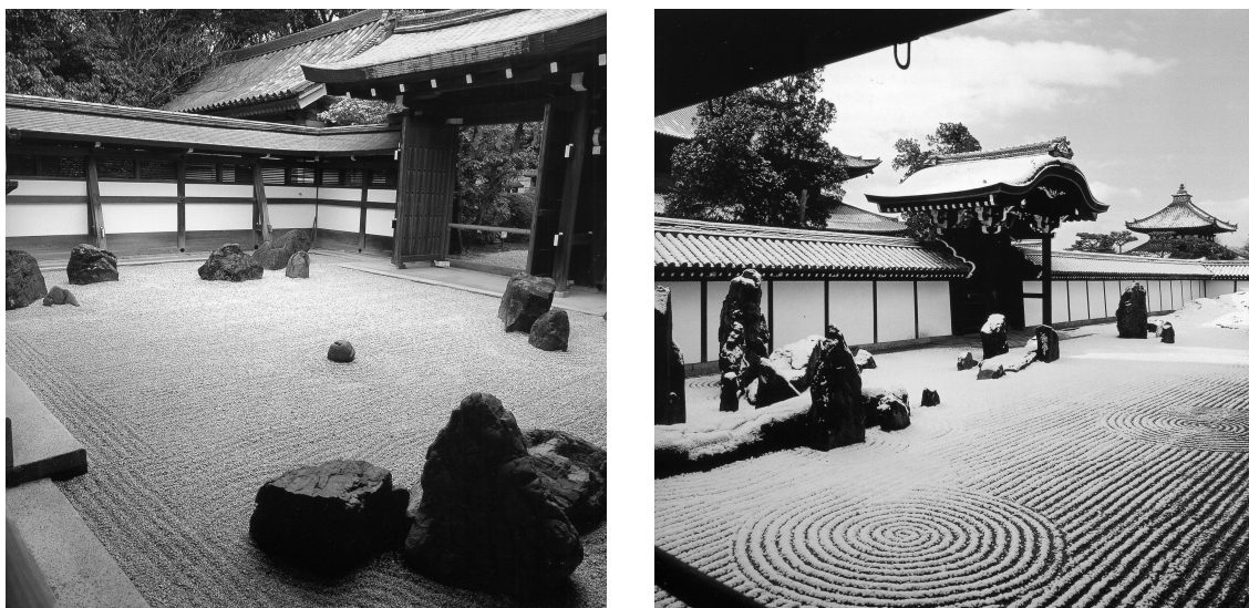
Рис. 6. Вид на «философский» сад

Интересен и «философский сад», созданный 600 лет назад. Он небольшой: всего 20 метров в длину и метров 10 в ширину. С одной стороны прямоугольника черный, блестящий деревянный помост. Сидя на пятках босых ног, проходящие в сад люди смотрят с помоста на четырехугольник «сада», ограниченный с трех сторон невысокой каменной стеной. «Сад» покрыт желтым песком. На нем ровные бороздки, сделанные граблями. Из песка торчат 16 серых камней, расположенных так, что сидящие на помосте с любой точки его видят только 15 камней. Один камень всегда выпадает из поля зрения (Рис. 6).