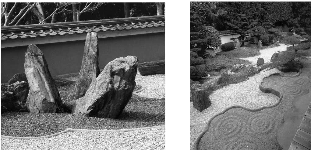
Рис. 2. Композиции из камней

Можно восхищаться тем, как используются камни в японском саду. Выбор их определяется и цветом, и формой. Наибольшую популярность имеют андезит, гранит, различные сланцы и шпаты. Единичные камни в садах кладут редко, обычно составляются композиции из двух–пяти штук (Рис. 2).