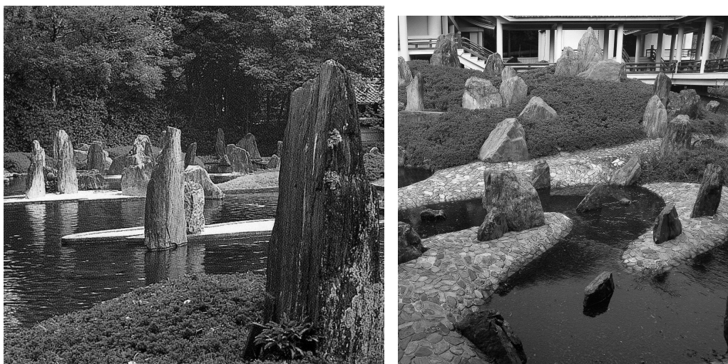
Рис. 3. Использование воды в японском саду

Вода – основа жизни любого сада. Японский художник-пейзажист знает лучше других, какой удивительный живописный эффект можно получить, повторив пейзаж отражением в воде. Подобно тому, как зеркала зрительно увеличивают размеры комнат, вода в саду удваивает все самое интересное в нем, создавая впечатление большего пространства (Рис. 3).